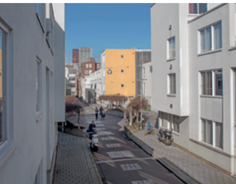
Katerstraat 1987, de vernieuwende aanpak van de stadsvernieuwing

N.B. Excursie naar Couperusduin en het opmerkelijke kantoor van Atelier PRO: zie pagina 18.