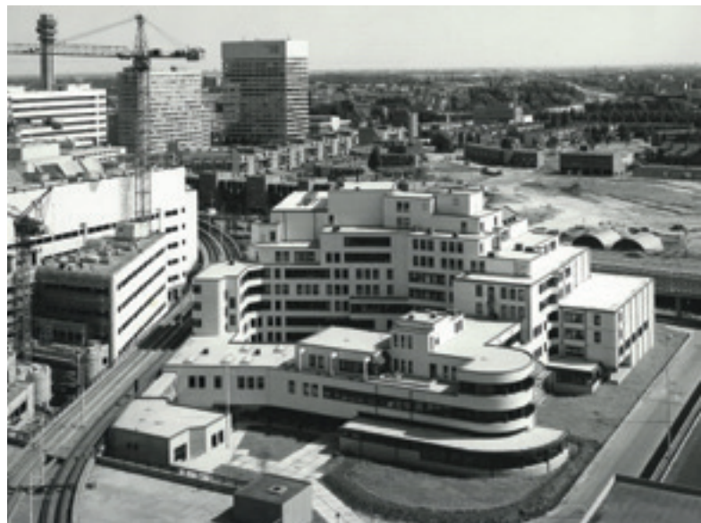
1980. Bezuidenhout-West ligt nog grotendeels braak