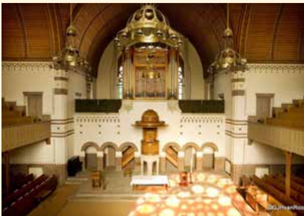
Interieur Nieuwe Badkapel, foto G.J.H.van Roon

De Badkapel komt aan het Gevers Deynootplein te staan. Als ze na veertig jaar moet wijken voor de uitbreiding van het 'badhuis' en – met hulp van het gemeentebestuur – haar een plek op steenworp afstand in de duinen wordt toegewezen, krijgt de Nieuwe Badkapel een eigensoortige vorm. Als grondvorm koos de architect – de Scheveninger W.Ch. Kuijper jr. (1879-1961) – het kruis, het universele symbool van het christendom. Via twee torens ['peperbussen'] maakte hij de kerk zichtbaar tot op het strand. Hij richtte het gebouw zo in dat iedereen goed zicht had op de kansel; het Woord is immers het middelpunt van de protestantse dienst. En vooral creëerde hij veel licht en ruimte. Het geheel ademt iets oos-