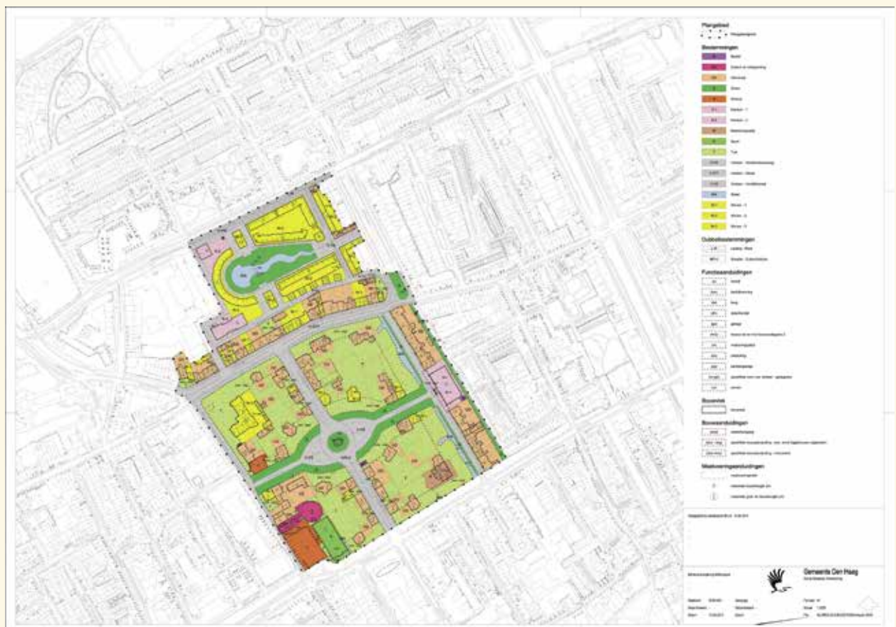
Plein 1813 op een verbeelding met bijbehorende legenda

Van de genoemde zeven pleinen hebben het Anna Paulownaplein en het Prins Hendrikplein van de politiek het stempel horecaplein gekregen. Dat wil echter nog niet zeggen dat de totale openbare ruimte ook gebruikt mag worden voor horeca-exploitatie. Volgens het bestemmingsplan is daar alleen binnen de bebouwing horecaexploitatie toegestaan. Zo hebben de kernen de bestemming 'groen' gekregen en zijn horecaterrassen daar dus niet toegestaan. Onlangs is gebleken dat bij het in gebruik geven van de openbare ruimte op pleinen de bestemming zo nu en dan over het hoofd wordt gezien.