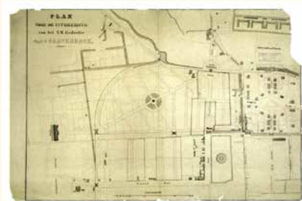
Op dit gemeentelijk uitbreidingsplan is rechts Plein 1813 te zien. Links daarvan is een ontwerp getekend voor de aanleg van het Anna Paulownaplein en het Prins Hendrikklein.

werd in metropolen als Parijs en Londen al toegepast, zodat de Haagse stadsarchitecten van de negentiende eeuw de kunst alleen maar hoefden af te kijken. Er werden prachtige nieuwe ontwerpen gemaakt, die helaas vanwege het verschil van inzicht tussen de bouwgrondmaatschappijen en de gemeente niet uitvoerbaar bleken. Gelukkig zijn er schetsen bewaard gebleven.