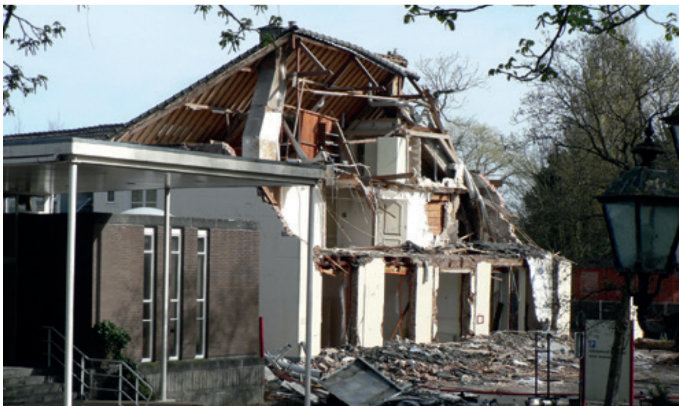
Hoeve Ysendoorn in afbraak. Foto Jan van der Ploeg

Jan van der Ploeg, Werkgroep Levende Historie