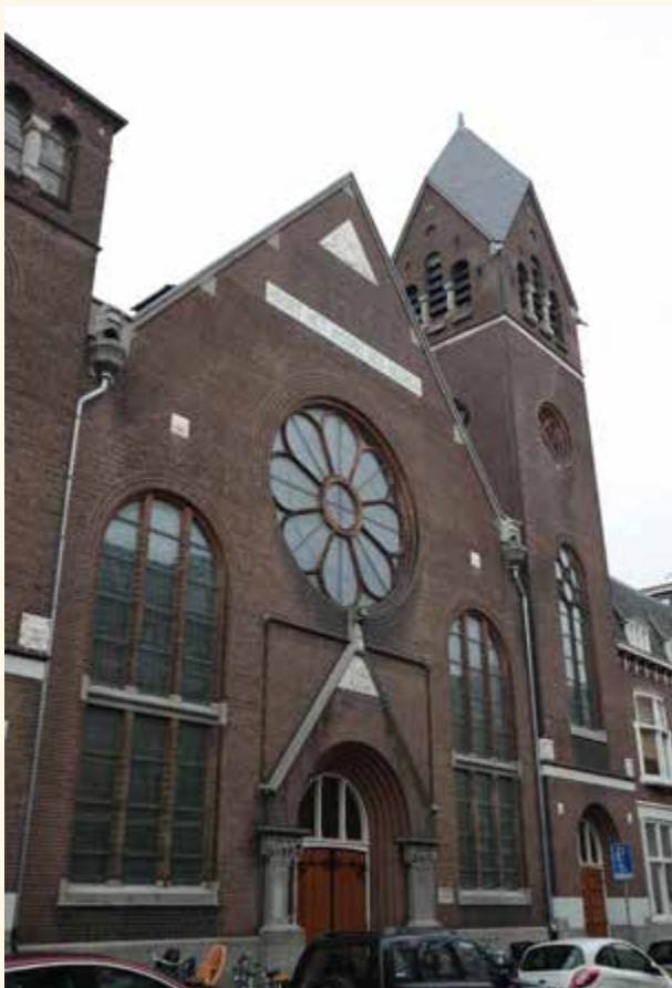
Noorderkerk, Schuytstraat 11