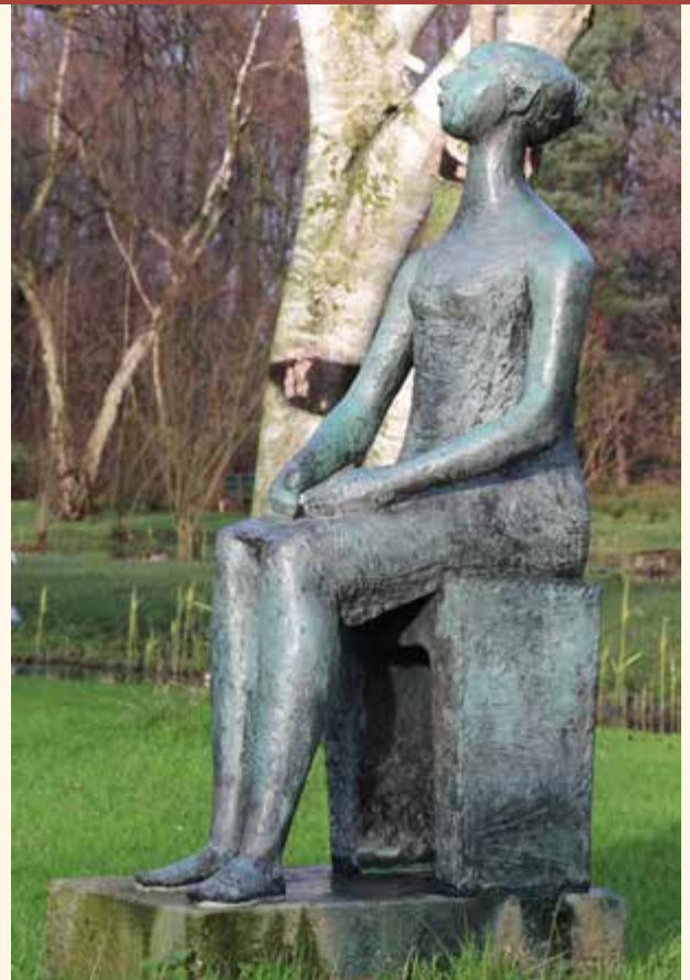
Rudy Rooijackers, Meisje op bank, brons, 1963, Loevesteinlaan in Zuiderpark