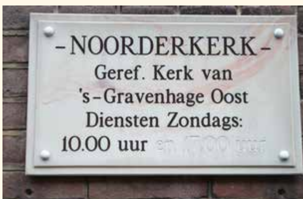
Leg dit maar eens uit!

Het gedraai met windstreken blijft overigens niet beperkt tot Den Haag zelf. Ook de randgemeenten doen vrolijk mee: Oosteinde en Westeinde in Voorburg en de hofsteden Oosterloo, Zuiderloo en Westerlo; in Leidschendam de Westvlietweg en de Oostvlietweg; in (ex-)Wateringen het Oosteinde, in (ex-)Rijswijk de Noordpolder. En zo kunnen we nog wel even doorgaan.