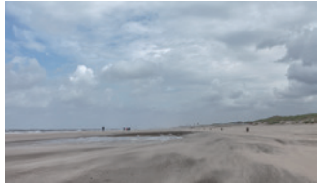
Rust aan zee en strand

kunnen er expats die in Amsterdam werken komen wonen in de woontorens naast Hollands Spoor, maar dat is geen goede bestemming van schaarse Haagse bouwgrond. Als middengroepen noodgedwongen Den Haag verlaten, verdwijnt de brug tussen meer en minder welgestelden en valt de stad uiteen. De gevolgen daarvan zullen snel zichtbaar worden in het stadsbeeld: de kwaliteit van de openbare ruimte raakt ongelijk verdeeld. De stad raakt uit balans en verliest haar aantrekkingskracht. De oplossing zit in gemengde wijken zonder al te grote verschillen in leefbaarheid.