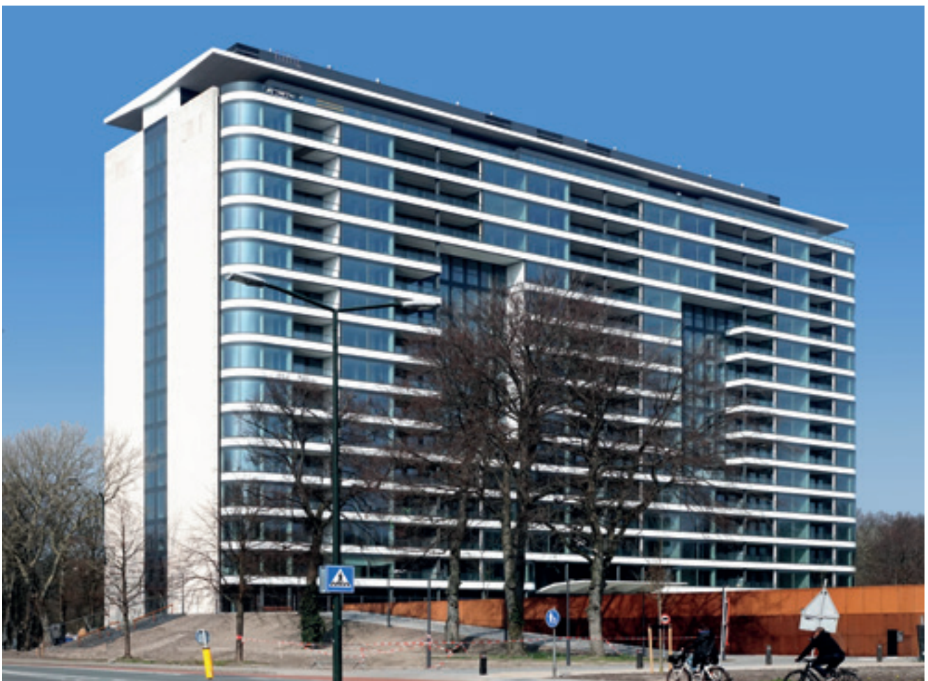
Park Hoog Oostduin, exclusieve appartementen in voormalig Shell kantoor

gebruiken, levert dat ook beperkingen op voor bezoekers. Waar een terras staat, kunnen mensen niet vrij bewegen. De kwaliteit van grote delen van het Haagse strand is rust en ruimte. Dat legt beperkingen op aan het bouwen van strandhuisjes en toeristische attracties. Bij het stimuleren van de Haagse economie en de horeca en bij het verlenen van terras- en nachtvergunningen zal de gemeente steeds