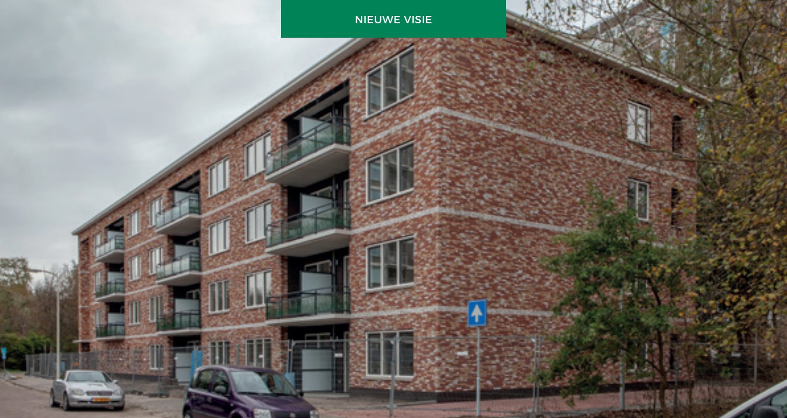
Nieuwbouw sociale woningen aan de Narcislaan