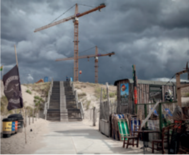
Strand en duinen bedreigd op Kijkduin

goed moeten letten op de belangen van de lokale bevolking. Bewust beleid is ook nodig wat betreft het toerisme. Het is verheugend dat Den Haag veel bezoek van buiten krijgt, maar er zijn grenzen, zeker voor Airbnb. Voor de Vrienden van Den Haag geldt: de stad moet een aantrekkelijke woonstad blijven, ook in het centrum en aan de kust. Onze stad mag geen pretpark worden.