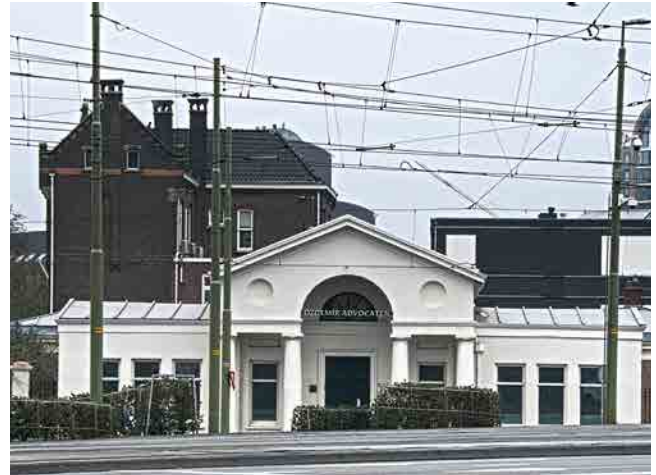
Het Wachtje nu

Veel wordt de laatste jaren gesproken over de skyline van Den Haag. De iconische hoge torens die de stad het aanzien geven van een Manhattan aan de Haagse Vliet. Die skyline zou er niet zijn als er geen tegenhanger was in het horizontale vlak. Het patroon van wegen en pleinen waarlangs wij van A naar B snellen in de jachtige stad. Lang niet altijd zijn wij ons dan bewust van de plek waar we eigenlijk zijn. In een serie artikelen beschrijven wij daarom een aantal lange lijnen die onze stad kenmerken. In het vorige nummer van ons Den Haag (2021.01) was dat de Laan van Meerdervoort. Dit keer hebben wij het over de Rijswijkseweg.