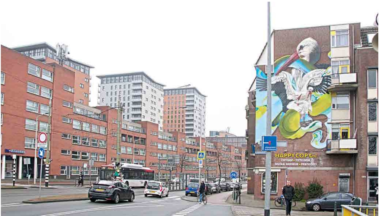
Het Schipperskwartier

van der Heijdenstraat, zijn we weer in Den Haag, in de wijk Molenwijk. Hier veroorzaakt de Rijswijkseweg een tweedeling. De zuidwestkant links loopt tot aan het Lorentzplein en wordt de Punt genoemd. Een wijk die in de jaren negentig stevig werd vergroend door de aanleg van het buurtpark Deimanstraat-Drebbelstraat. Twee hele bouwblokken werden er voor gesloopt. Aan de Rijswijkseweg bepaalt een hoeveelheid bedenkelijke massagesalons het straatbeeld. Daar heeft de gemeente nu de rem op gezet. Aan de overkant bevindt zich achter de gesloten gevelwand een ruim opgezette woonwijk, met langs de Noordpolderkade een mooie lange groenstrook. Wij treffen er het druk bezochte Ketelveld, met speelweides en sportvelden, een Cruijff Court en een Richard Krajicek Playground. Iets wat je, verstopt achter de drukke weg, niet meteen zou verwachten.