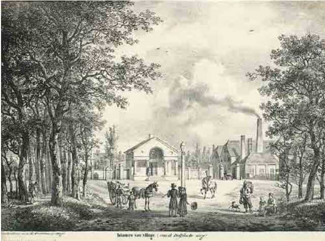
Het Wachtje omstreeks 1835