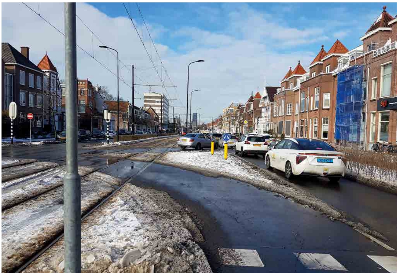
Haagweg en Rijswijkseweg, met het Strijkijzer aan de horizon

Vanaf dit punt terug naar het Rijswijkseplein komen wij eerst door Rijswijk met links de woonwijken van het oude Rijswijk, het parkje Hofrust en het oude stadhuis en aan de rechterkant de woningen van de wijken Leeuwendaal en Cromvliet. Voorbij de Broeksloot, het kruispunt met de Jan