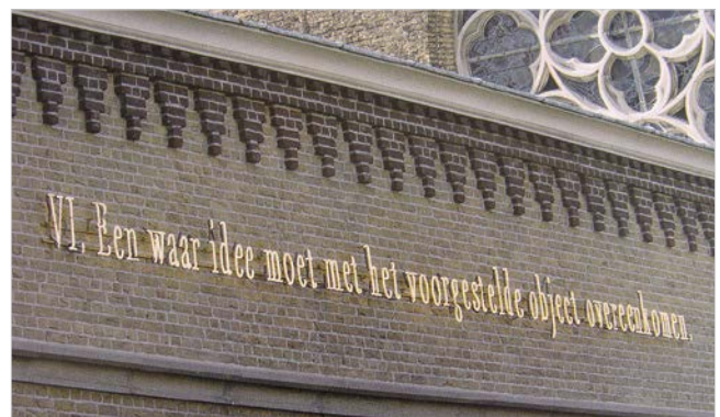
Een van de citaten van Spinoza, aan de buitengevelwand in de Gotische Zaal

stad van vrede en recht. Daartoe is de stichting Spinoza Den Haag opgericht, waar de Leidse Universiteit en de Erasmus Universiteit bij betrokken zijn. In december heeft het Monumentenfonds het eigendom van het Spinozahuis overgedragen aan de Foundation Domus Spinozana. In de leeszaal wordt in oktober van dit jaar de tentoonstelling 'Het dagelijks leven van Spinoza in Den Haag' geopend. Het is de bedoeling om over enige tijd het hele huis om te