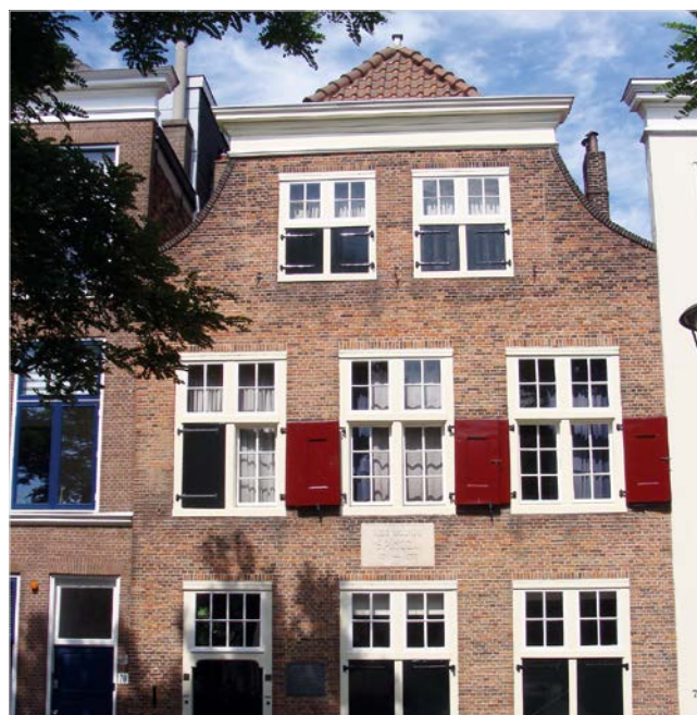
Spinozahuis aan de Paviljoensgracht