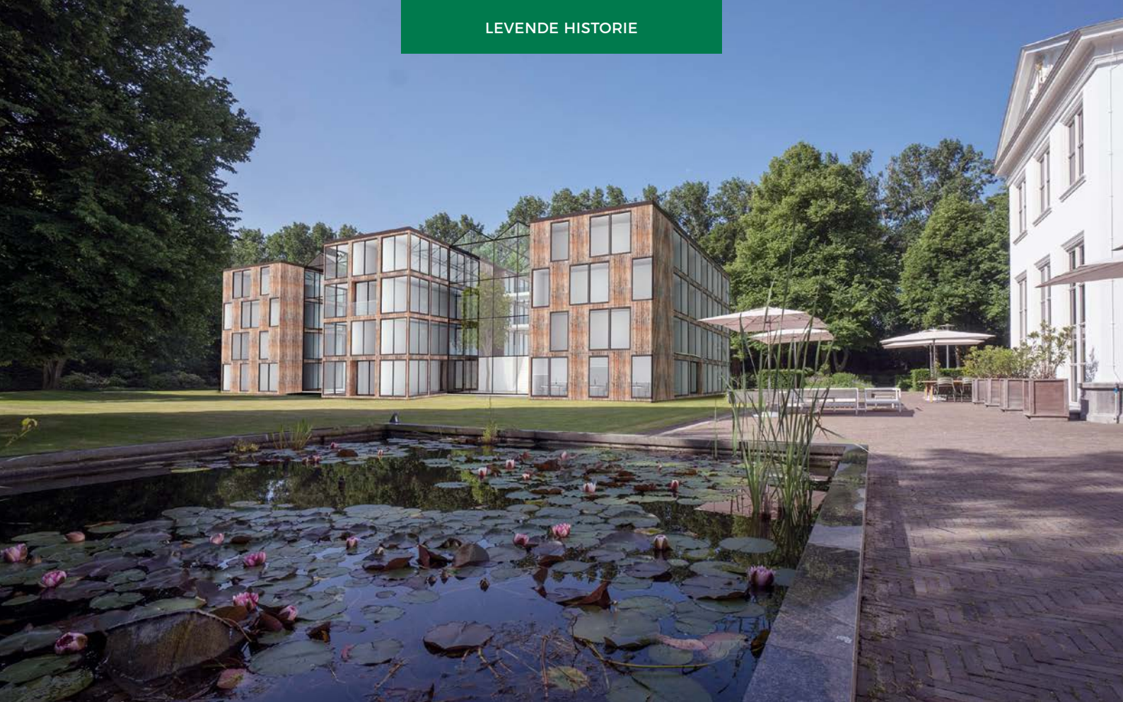
Schetsontwerp Catshuisterrein