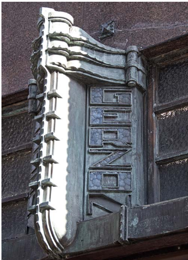
Geveldetail voormalig modehuis Gerzon in de Venestraat

Spinoza zijn Ethica en schreef hij zijn Politiek Traktaat. In het St. Joannes de Deo ziekenhuis aan het Westeinde werkte de beroemde patholoog en Nobelprijswinnaar (1930) Karl Landsteiner, ontdekker van de bloedgroepen, rhesusfactor en het besmettelijke karakter van polio. En sinds 1933 staat aan de Riouwstraat 172 het International Esperanto Instituut, waar deze taal, het geesteskind van de joods-Poolse oogarts Zamenhof, wordt onderwezen.