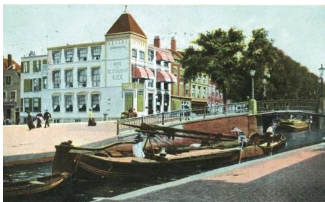
Voormalig hotel Kiek, hoek Wagenplein-Bierkade

In 1694 ontstond de joodse begraafplaats in het – toen nog – niemandsland tussen Den Haag en Scheveningen. Men wilde een eigen, grote begraafplaats, ook omdat graven volgens de joodse wet eeuwig zijn en niet mogen worden geruimd. Bij de ingang bevindt zich het graf uit 1697 van de stichter, Ziskind Pos uit Poznan (Polen), die onder de naam Alexander Polak een winkel dreef op de hoek Spui/Gedempte Gracht.