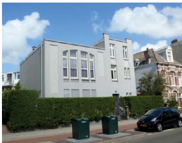
Voormalige synagoge aan de Harstenhoekweg 44 in Scheveningen

Portugese en Hoogduitse Joden werden tot 1710 gemengd begraven. Daarna kwam er een splitsing. Het Portugese deel is nu nog in gebruik, maar er kwam een apart Hoogduits gedeelte. Toen dat in 1900 bijna vol was werd in 1906 in Wassenaar een nieuwe Hoogduitse begraafplaats geopend. Onderdeel van het Haagse stadsbeeld zijn verder o.a. het joodse weeshuis, hofje, bejaardenhuis en ziekenhuis, het Rembrandt Theater (nu een Albert Heijn) en De Haagsche Kluis.