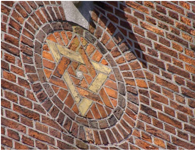
Davidster in de gevel van het joods hofje

aan goedkope woningen. Er kwamen twee joodse woningbouwverenigingen, waarvan 'de vereniging met de lange naam' (Vereeniging tot het Verschaffen van Woningen aan Minvermogenden) nog bestaat. Deze bouwde o.a. het joods hofje (de Van Ostade-woningen) in de Schilderswijk. De gevel toont een Davidster. Tijdens de stadsvernieuwing in de jaren zeventig werd het hofje na hevig bewonersprotest niet gesloopt, maar gerenoveerd. Een documentaire erover staat op de website van de Stichting Joods Erfgoed Den Haag.