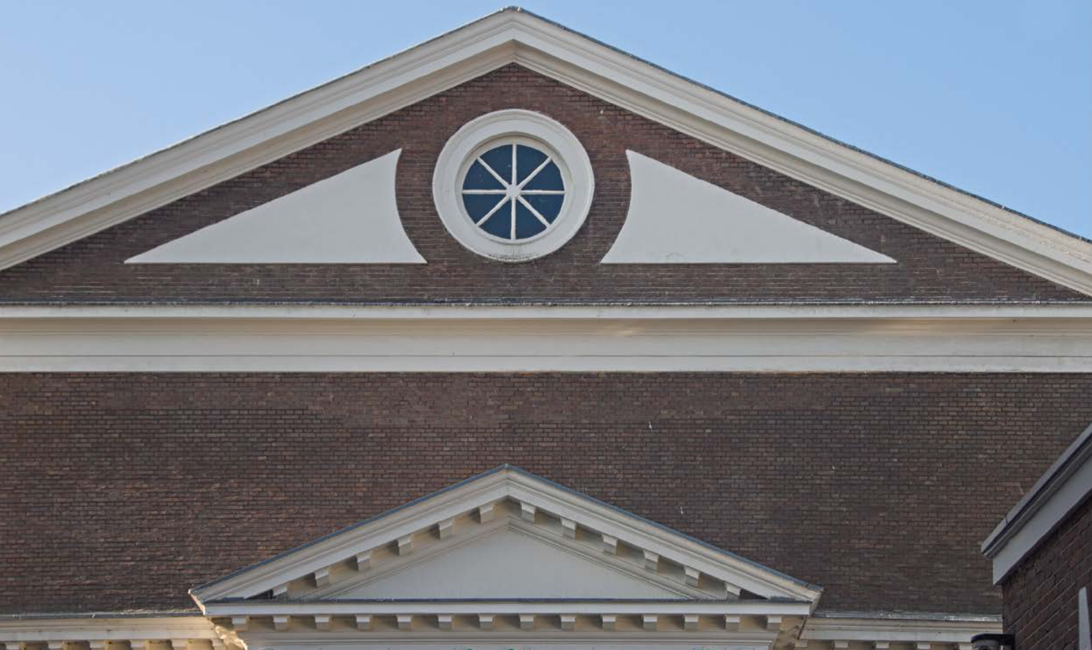
Fronton van de Grote Synagoge, de voormalige joodse synagoge aan de Wagenstraat in de vroegere jodenbuurt van Den Haag. Het gebouw is sinds 1981 in gebruik als de Mescidi Aksamoskee