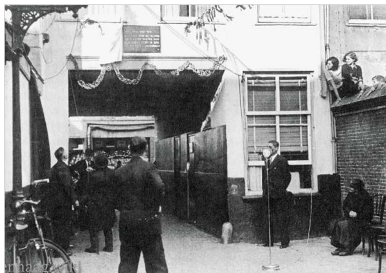
Onthulling gedenksteen bij het 50-jarig bestaan van de Van Ostadewoningen

Geraadpleegd: stichting Joods Erfgoed Den Haag en Wikipedia