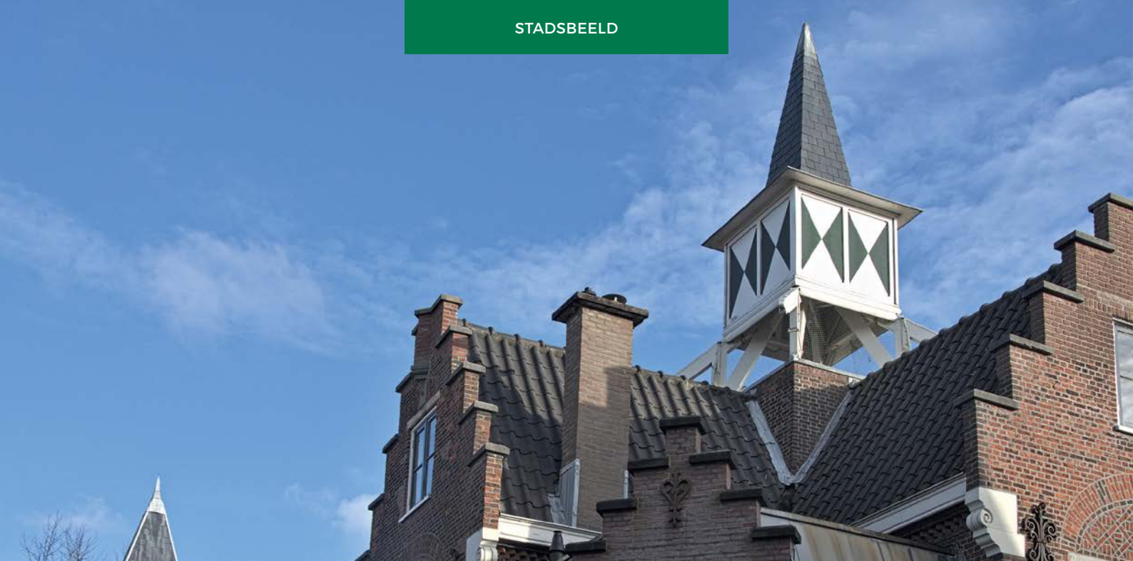
Het torentje van het hofje bij de Van Ostadewoningen, aan de Jacob Catsstraat