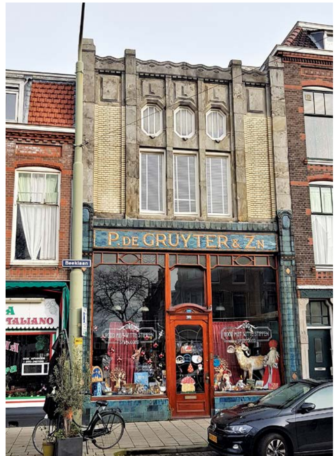
Het pand van De Gruyter aan de Beeklaan 303

de toren met het trappenhuis een 9 meter hoge lichtmast met de firmanaam. De etalages zaten verspreid over de gehele begane grond. Nu huist er de wereldmissie van Johan Maasbach.