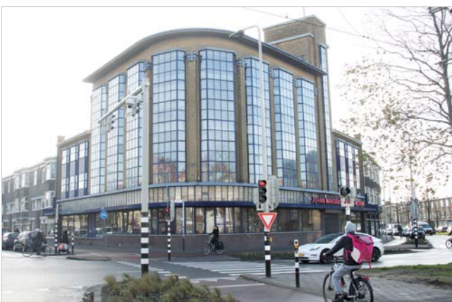
Voormalig Lijnkamp Kledingmagazijn

Prominent op de hoek van de Apeldoornselaan en de Loosduinsekade, zien we op nummer 1 het markante gebouw van het voormalige Lijnkamp Kledingmagazijn, met de ernaast gelegen bovenwoningen. Ook dit is een gemeentelijk monument, uit 1933, in de stijl van de Nieuwe Zakelijkheid. De architect is Dirk Oosthoek die er duidelijke elementen van de art-decostijl in heeft verwerkt. Typerend zijn de hoge erkerpartijen die in ijzer zijn uitgevoerd. Ooit stond er op