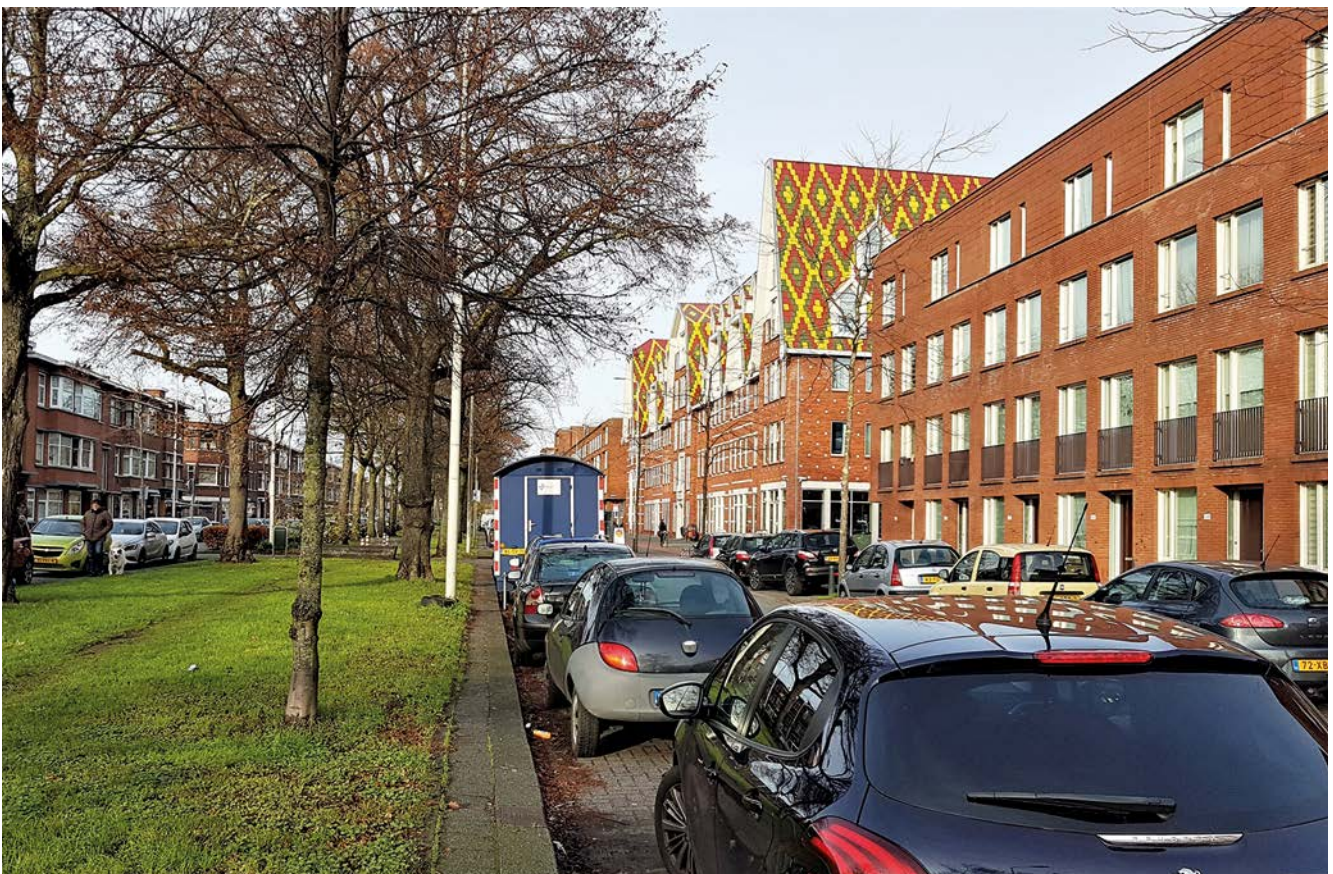
Het pand van de Kessler Stichting, met de geel-groen-rood geruite dakpannen, aan de De la Reyweg 530

Werkgroep Stadsbeeld en Stadsgroen stadsbeeldenstadsgroen@vriendenvandenhaag.nl