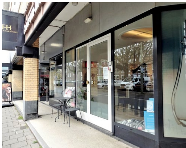
Een van de winkels in de galerij die onlangs is verbouwd.

de houten raamlijsten lichtvaardig verwijderd en vervangen. Het sluit op geen enkele wijze aan op de kwaliteit en het karakter van de oorspronkelijke galerij. Ook houdt men bij de nieuwe puien geen rekening met de originele vormgeving, details en materialen, met als gevolg versterking van karakter en ritme.