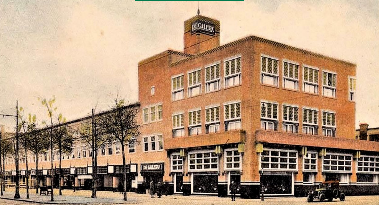
Winkelgalerij en theater hoek Laan van Meerdervoort/Fahrenheitstraat, 1926