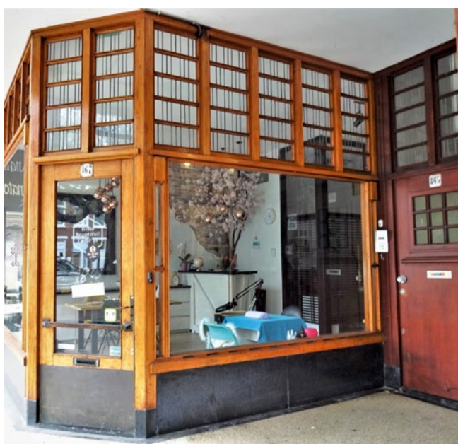
Nog in originele, karakteristieke staat verkerende winkelpui in de galerij

Hoewel het complex op het eerste gezicht nog wel de beoogde karakteristieke uitstraling heeft, verliest het door verrommeling aan kwaliteit. De allure van toen verdwijnt steeds meer. De gevel van het café-restaurant heeft plaatsgemaakt voor een pui met aluminium kozijnen. De ruimte erachter staat momenteel leeg. Het West End theater is omgebouwd tot supermarkt en de dansschool verhuurt ruimte voor opslag. Door nieuwe winkels in de galerij worden