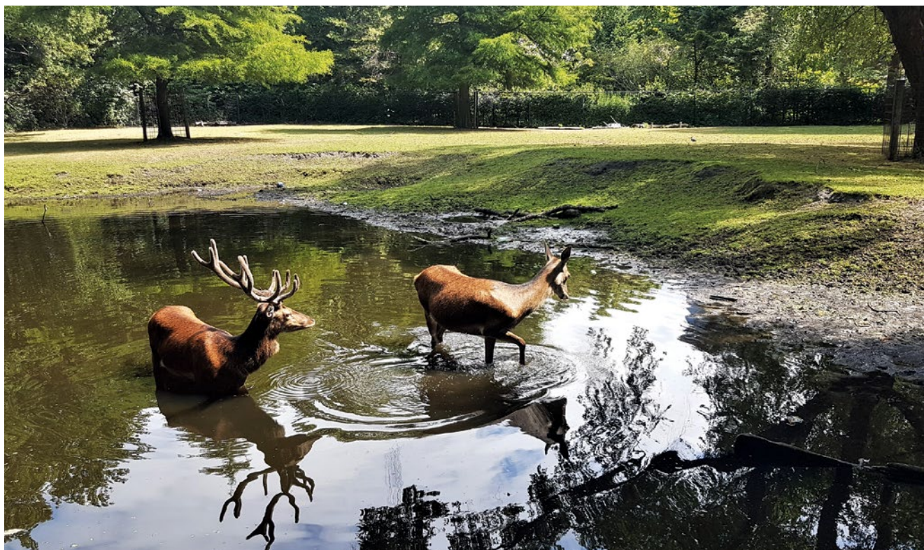
De hertenkamp blijft afgescheiden door water, maar is nu wel beter te bekijken

stadsbeeldenstadsgroen@vriendenvandenhaag.nl