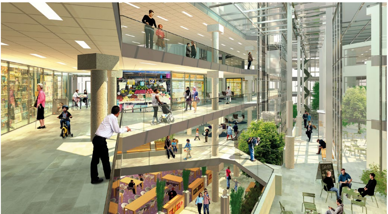
Visualisatie van de centrale hal (Bureau AHH)

VORM Ontwikkeling is de eigenaar van het SoZaWe-gebouw en wil deze plek graag ontwikkelen. VORM onderzocht de afgelopen jaren wat bewoners en bedrijven nodig zouden hebben. De gemeenteraad heeft voor deze plek aan de Anna van Hannoverstraat, ingestemd met een nieuwbouwplan dat