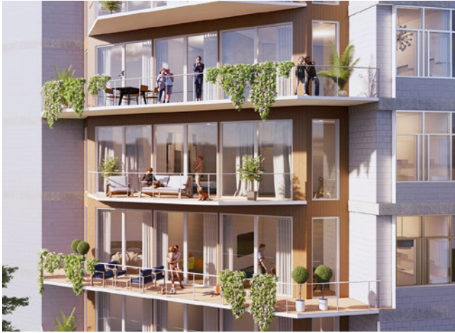
Visualisatie van een van de gevels (Bureau AHH)

maar aan variatie rond publieke ruimtes. Ik heb hem daarover een brief geschreven, dat wij zijn mening delen en blij zijn dat die opvatting deel uitmaakt van de besluitvorming van het gemeentebestuur van Den Haag. Hij heeft nog steeds niet geantwoord.”