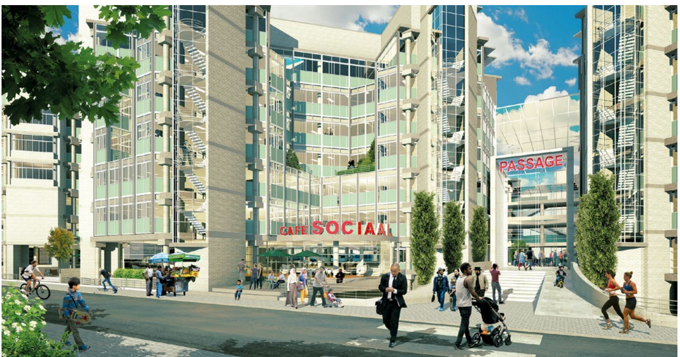
Visualisatie van de Zuidentree (Bureau AHH)

*Zie hiervoor Nota van Uitgangspunten Station Laan aan NOI (Den Haag Beatrixkwartier) en omgeving - mei 2015 en Planuitwerkingskader Anna van Hannoverstraat 5, Herontwikkeling voormalige Ministerie van Sociale Zaken en Werkgelegenheid – 26 mei 2021.