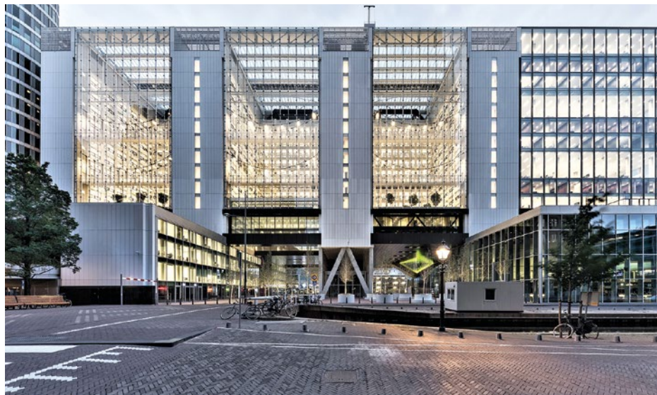
Voormalig VROM-gebouw, 1992. Na 2009 ingrijpend verbouwd