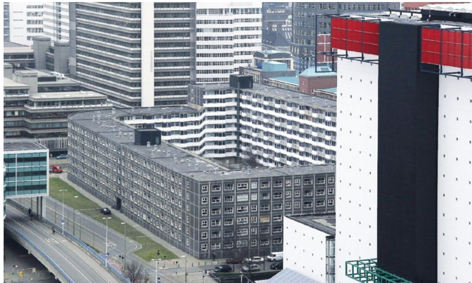
De Zwarte Madonna, 2006.