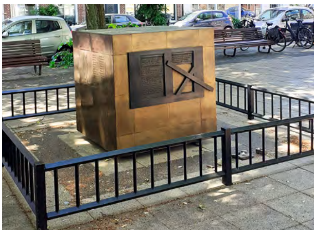
Sinti en Roma monument