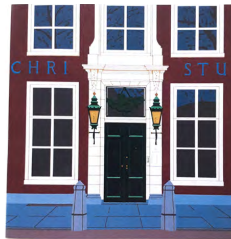
Pulchri Studio, Lange Voorhout (zeefdruk Frans de Leef)