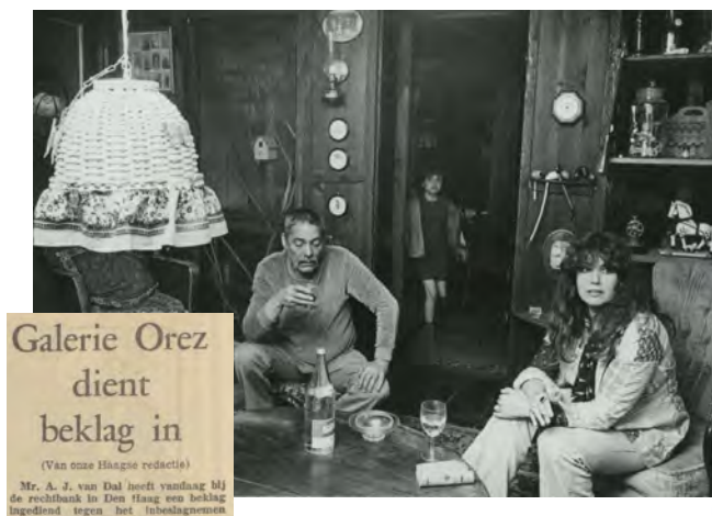
Galerie Orez

In 1968 werden door de zedenpolitie werken van een bekende Haagse kunstenaar uit een Haagse galerie verwijderd omdat deze werken pornografisch zouden zijn.