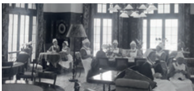
Verpleegsters in Bronovo