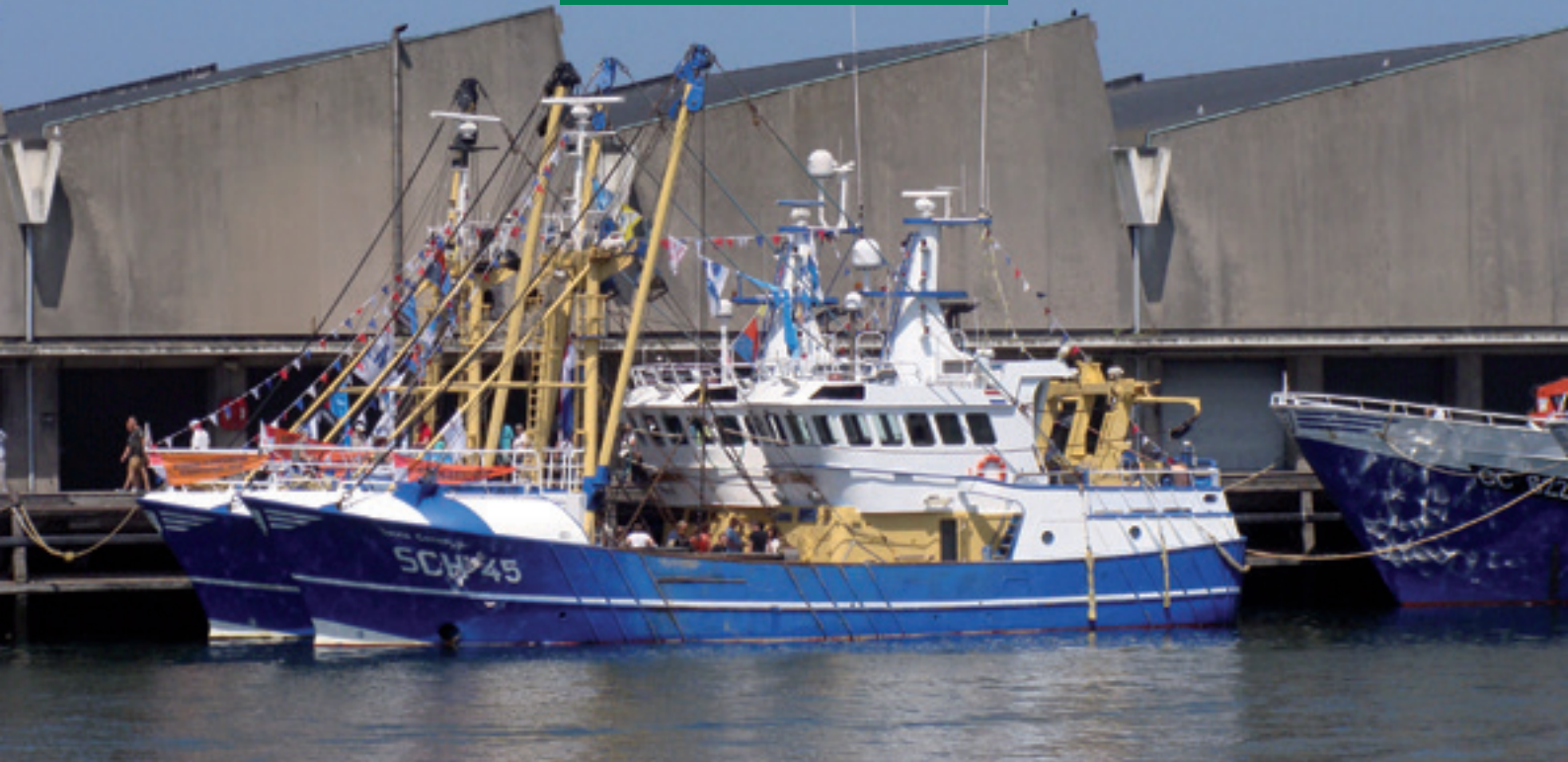
Vlaggetjesdag 2017 bij de visafslag.