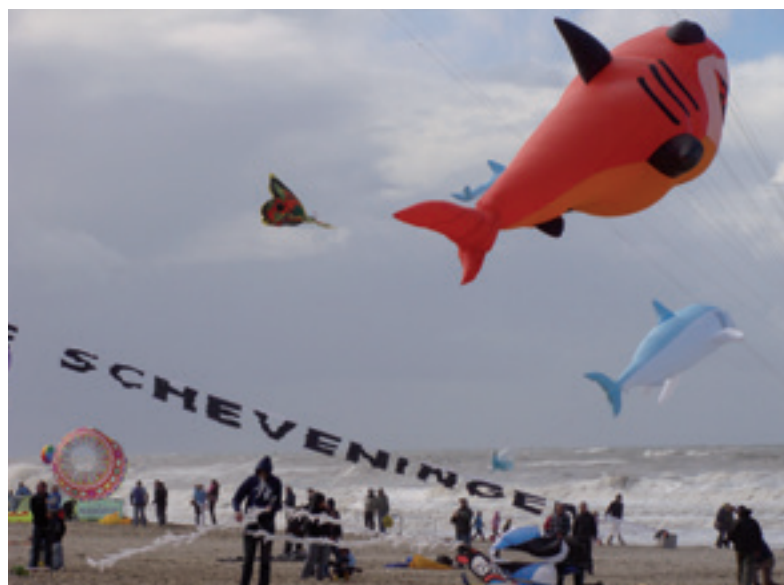
Vliegerfestival op het strand.

Elsbeth van Hijlckama Vlieg Werkgroep Stadsgroen en Stadsbeeld