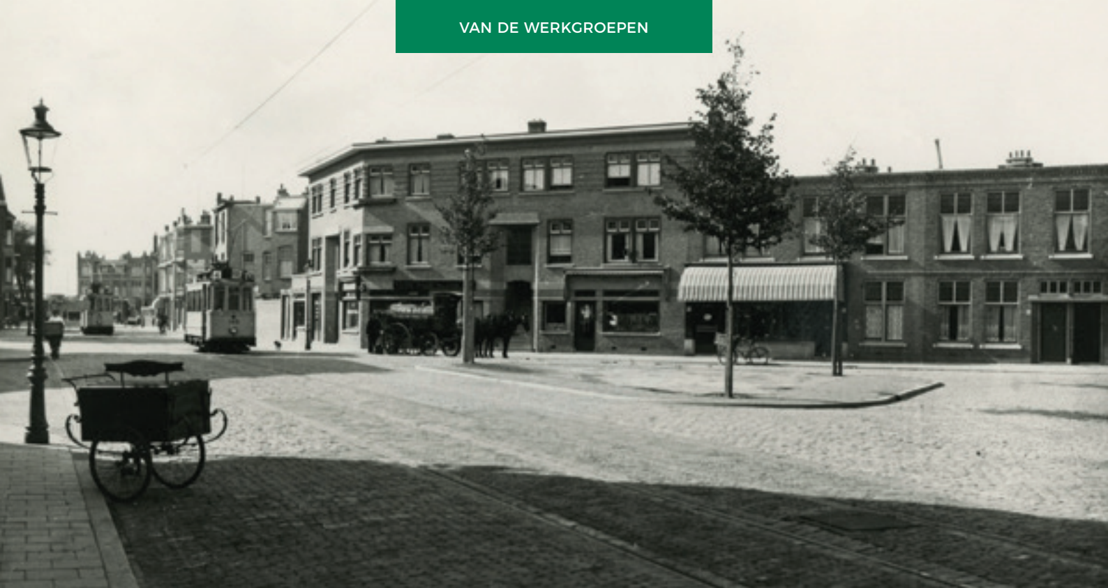
Stuyvesantstraat, pleintje bij de Hendrik Zwaardercroonstraat ca.1925.