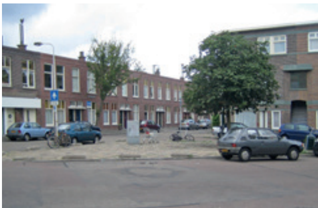
Het pleintje in de Stuyvesantstraat vóór de vernieuwing.