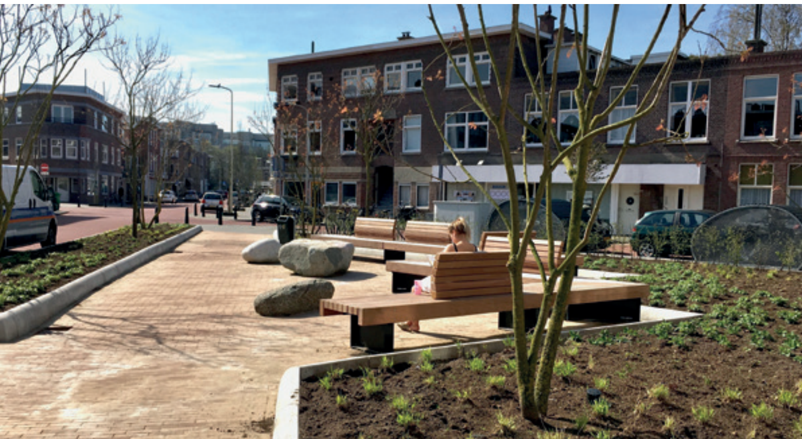
Stuyvesantstraat, het eerste nieuw ingerichte plein.