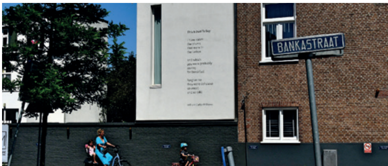
Een gedicht van William Carlos Williams in de Bankastraat

De gedichten zijn relatief kort en vaak in vrije versvorm; een enkel gedicht heeft een rijmschema. Naast bekende Nederlandse namen (Rutger Kopland, J.C. Bloem) zien we ook Engelstalige dichters van wereldformaat als Derek Walcott en William Carlos Williams. De meeste gedichten zijn modern; de 17 e eeuwse alleskunner Constantijn Huygens is een goed gekozen uitzondering.