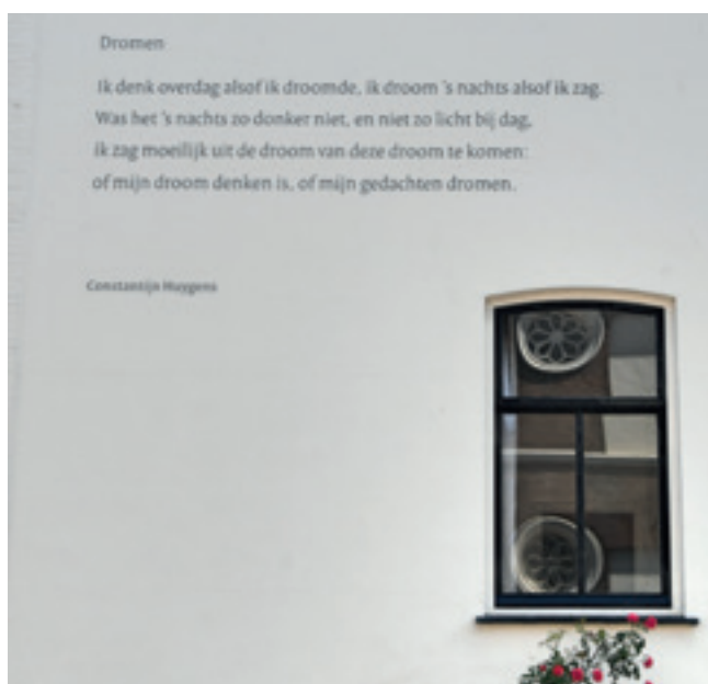
Gedicht van Constantijn Huijgens aan een muur op de hoek van Atjehstraat en Bankastraat