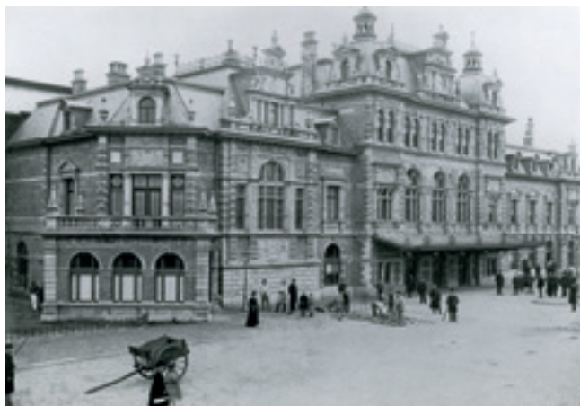
Het station met links de originele ingang van de Koninklijke Wachtkamer ca. 1900.