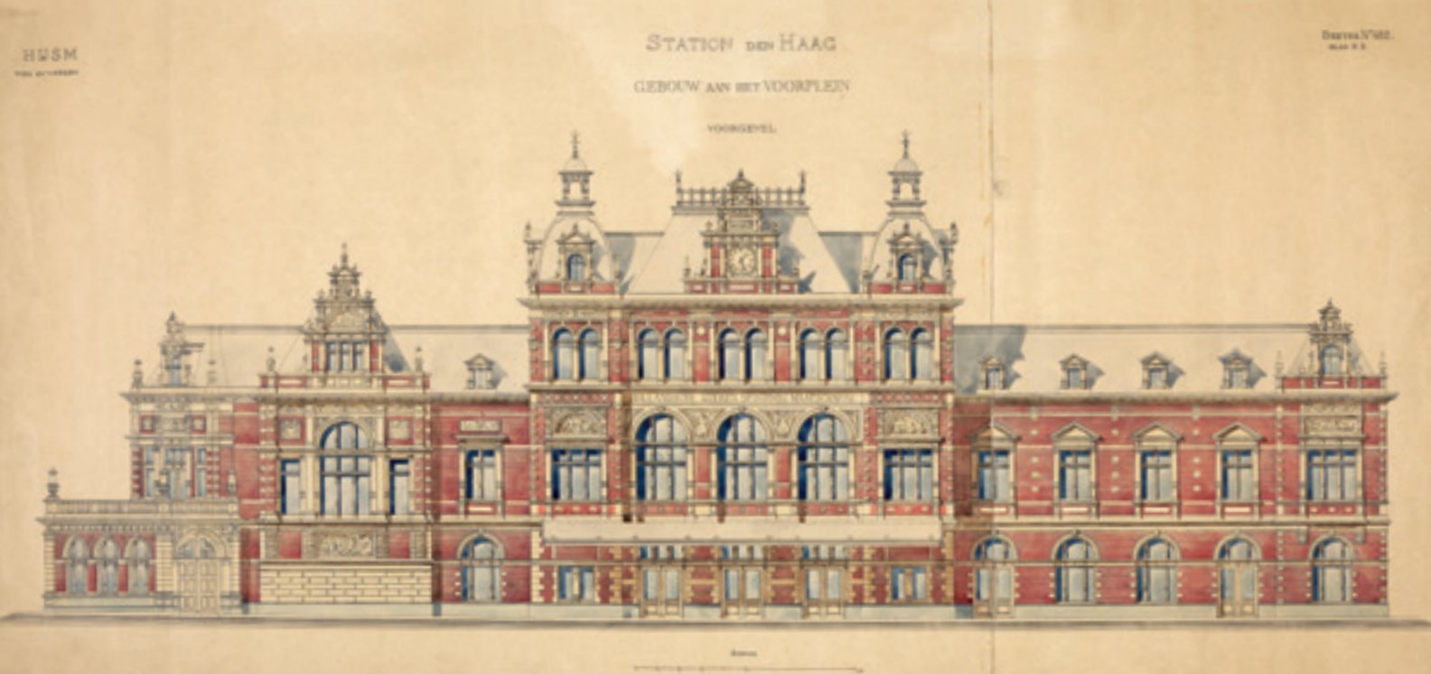
De bestektekening van architect D.A.N. Margadant