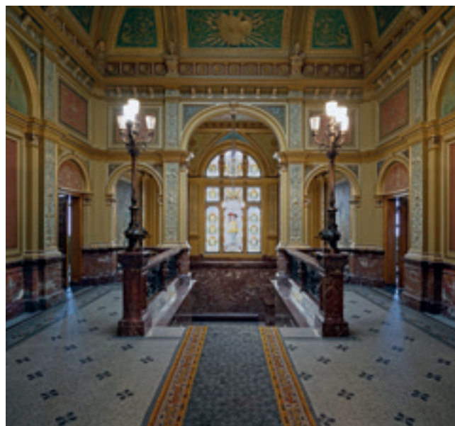
Trapportaal van de Koninklijke Wachtkamer.

De eerste Nederlandse spoorlijn Amsterdam – Haarlem (1839) is al in 1843 doorgetrokken naar Den Haag en Rotterdam. De trein kwam met een snelheid van wel 35 km/uur door het weiland aanrijden en stopte achter een neoclassicistisch stationnetje, een soort Grieks tempeltje dat destijds in de gemeente Rijswijk lag. De snelle groei van de reizigersaantallen en de hinder voor het vele kruisende verkeer maakten al spoedig ophoging van het spoor en een groot station met perrons en overkapping noodzakelijk. In 1893 – het gebied was inmiddels Haags geworden – werd het rijk gedecoreerde