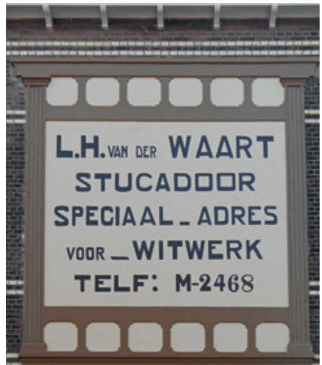
Frederik Ruyschstraat, op zijgevel Valkenboskade 211