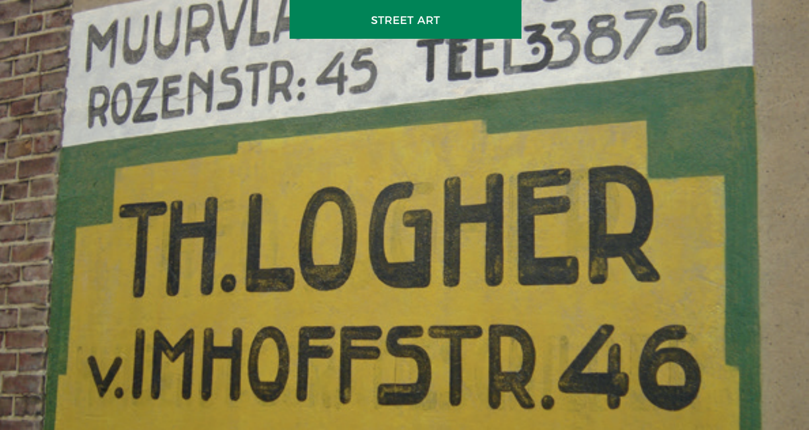
Op zijgevel van Johan van Hoornstraat 44