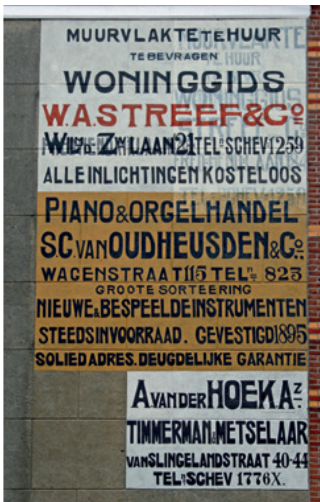
Muurreclame op de zijgevel van Fred. Hendriklaan 234

Ondanks de negatieve reacties nam de muurreclame in het interbellum in Den Haag een grote vlucht. Ook in de wijken rondom het centrum verschenen op grote blinde muurvlakken geschilderde reclames. Vooral de muren op hoeken van drukke doorgaande wegen, zoals de Loosduinseweg, waren zeer geliefd. Van de grote diversiteit aan muurreclames, van letterreclames tot bijzondere reclames met figuren, resteren er tegenwoordig nog zo'n 50, waarvan een groot deel fragmentarisch. De Stichting Haags Industrieel Erfgoed (SHIE) maakte in 2004 een inventarisatie hiervan en gaf een routeboekje uit met de meest markante schilderijen en hun verhaal.