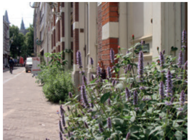
De Herenstraat bij het Plein – door de bewonersorganisatie en bedrijven 'vergroend' met geveltuintjes.