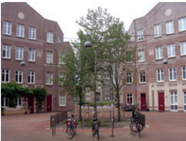
Het Hillebrant Jacobsplein in de Rivierenbuurt – een van de heetste plekken van de stad. Op initiatief van de bewonersorganisatie en de AVN is er een begin gemaakt met vergroenen.

stadsbeeldenstadsgroen@vriendenvandenhaag.nl