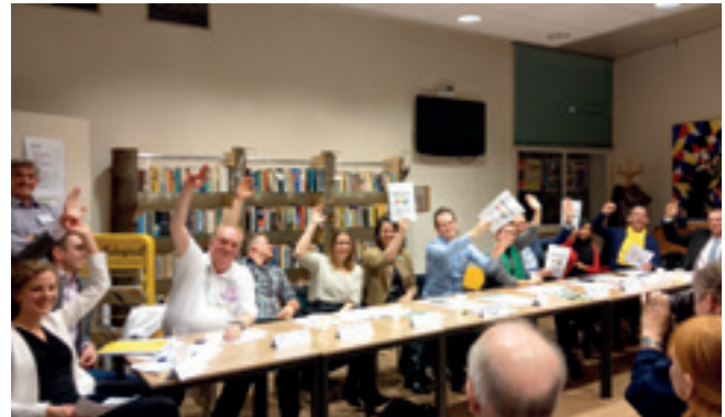
Enthousiaste instemming met 'Wijkinbreng' door vertegenwoordigers van de diverse wijkorganisaties.

Vanachter een bureau vergunningen verstrekken is niet de juiste bestuurlijke weg. Alleen op basis van een plattegrond en de geldende regels wordt onvoldoende duidelijk wat de uiteindelijke invloed van een vergunde activiteit zal zijn in de omgeving.