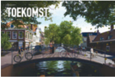
De nieuwe Paviljoensgracht in het spoor van Spinoza als de Gracht van Vrede en Recht