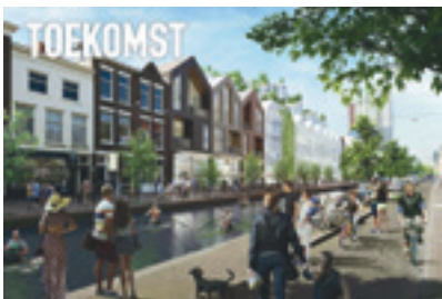
De nieuwe Amsterdamse Veerkade met kanovaarders en rechts op de foto een markthal