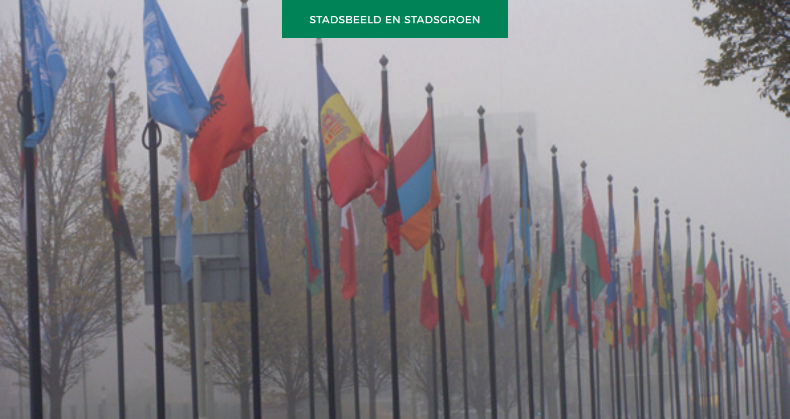
Vlaggen van alle landen aan de Stadhouderslaan