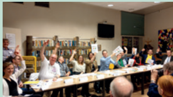
Enthousiaste instemming met 'wijkenbreng' van raadsleden en 2 wethouders tijdens een politiek debat in de maand februari van het verkiezingsjaar 2018.

In Ons Den Haag 2019.06 is tot onze spijt een foto met onjuist onderschrift gepubliceerd. Het betreft de foto op pagina 5, behorend bij het artikel 'EEN STADSBREED VERLANGEN'. Hieronder de betreffende foto, nu met het juiste onderschrift.