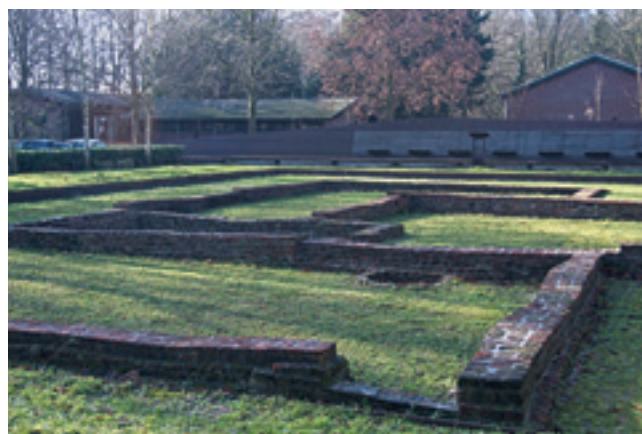
De Stenen Kamer

Fietsen we verder naar het zuiden dan zien we een geleidelijke overgang van de laagbouw naar het groene open buitengebied van het park Madestein. Vanaf 2004 verrees hier, aan de andere kant van de Lozerlaan, midden in het groen en op een voormalig kassengebied de langgerekte villawijk Vroondaal. Het ging erom hier als het ware een tweede Wassenaar-Zuid te realiseren, door op grote kavels particuliere bouwers de vrije hand te geven. De grote variatie aan bouwstijlen die zo ontstond is nu een intrigerend schouwspel. Smaken verschillen, dat is zeker. Er is ruimte voor zo'n 2000 huizen die rond 2025 allemaal gebouwd zullen zijn. Aan de zuidkant van deze strook, tussen de Madepolderweg en de Boomaweg, ligt Vroondaal-Zuid. Je zou het niet direct verwachten, maar het woningaanbod hier is gebaseerd op karakteristieke Haagse huizen zoals in het Belgisch Park en Statenkwartier. De geïsoleerde ligging van Vroondaal maakt dit een eigenzinnig stukje nieuwe stad. De vraag is, wordt het echt een Haagse wijk of blijft het een bebouwde groenstrook die uiteindelijk gaat functioneren als onderdeel van het Westland?