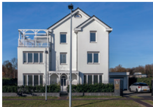
Huis in Vroondaal

Bewegen we met de klok mee vanaf Kom Loosduinen via Kraayenstein, Madestein en Vroondaal naar het westen dan komen we bij de wijk Ockenburg/Kijkduin, die tegen de grens met Monster aan ligt. Daarover gaat het volgende deel van deze korte serie over het stadsdeel Loosduinen in Ons Den Haag.