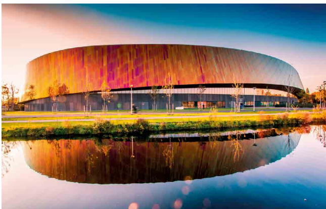
Sportcampus Zuiderpark

De stad kennende weet de socialist Berlage dat arbeiders zich niet verpozen in het Haagse Bos, laat staan dat ze ontspanning zoeken onder het groen van het Lange Voorhout. En dan heeft hij niet enkel de fysieke afstand in gedachten. De enorme bevolkingstoename is toe te schrijven aan de komst