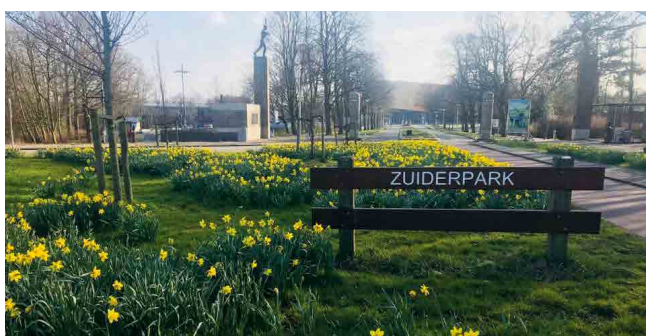
Zuiderpark ingang Veluweplein

Rond 1845 telt Den Haag ongeveer 70.000 inwoners, 100.000 in 1870 en 200.000 in 1900. Het is dan in 1907 ook geen overbodige luxe voor het toenmalige stadsbestuur om een uitbreidingsplan te laten maken. Architect H.P. Berlage krijgt de opdracht.