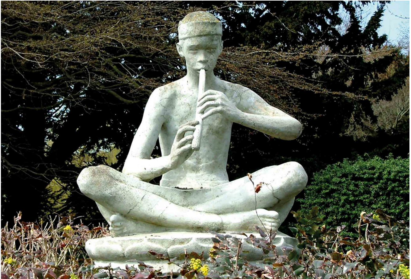
Orpheus in de Dessa van Lidy Buma van Mourik Broekman

Vrijdagmarkt in Gent waar het gebouw van Ons Huis - Bond Moyson nog steeds getuigt van zo'n 'paleis voor arbeiders'.