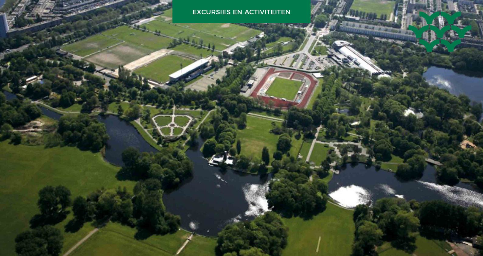
Blik op het Zuiderpark richting Morgenstond