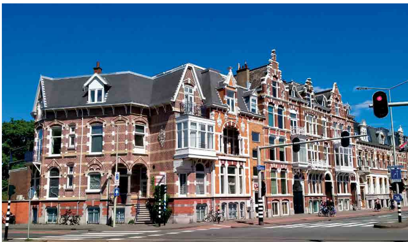
Hoekpand Groot Hertoginnelaan - Stadhouderslaan en aangrenzende herenhuizen, een compositie van Hoek & Wouters

Rond 1905 slaat het architectenbureau zijn vleugels uit naar Wassenaar. Daar worden exploitatiemaatschappijen opgericht voor de bouw van villaparken zoals Groot Haesebroek en Park De Kieviet. Hoek & Wouters weten in Wassenaar een stevige vinger in de pap te krijgen, met als resultaat een groot aantal villa's en landhuizen. De heren kunnen het intussen al lang niet meer alleen af en maken ook gebruik van de diensten van collega-architecten