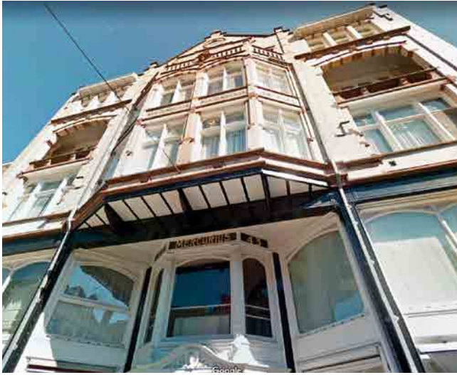
Voormalig kantoorpand Mercurius aan het Noordeinde