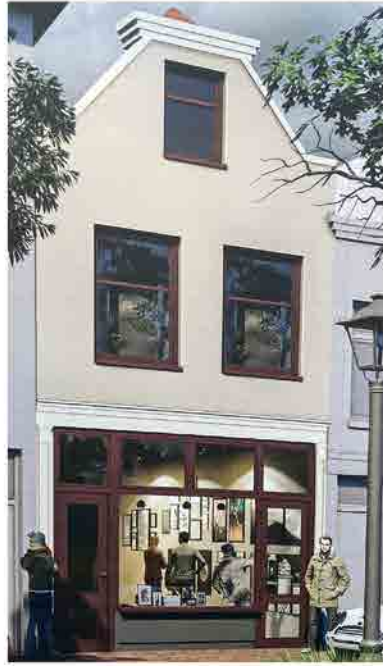
PAVILJOENGRACHT 133-133A PLAN WOM JANUARI 2020