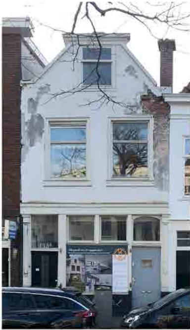
PAVILJOENGRACHT 133-133A HUIDIGE TOESTAND