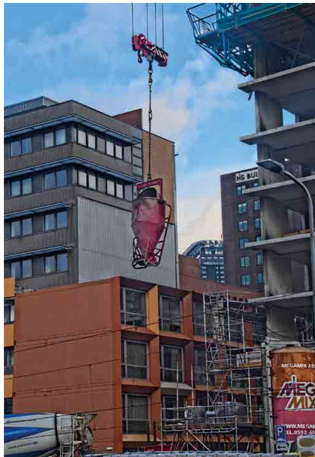
Er wordt al volop gebouwd in het plangebied

stadsbeeldenstadsgroen@vriendenvandenhaag.nl