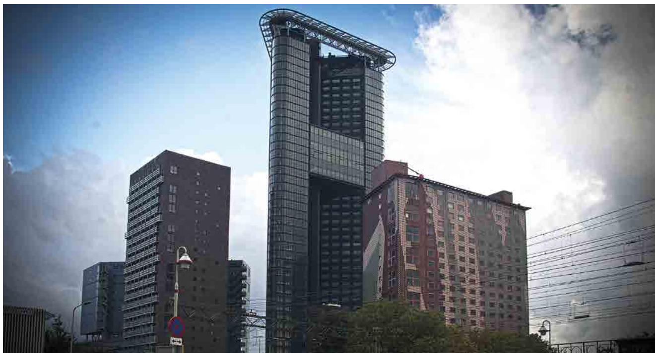
De Haagse Toren, beter bekend als het Strijkijzer, aan het Rijswijkseplein vlakbij station Den Haag HS. Met 42 verdiepingen en een hoogte van 132 meter beeldbepalend in het stadsgezicht van Den Haag. Het Strijkijzer (2007) staat op een kavel van slechts 30 bij 35 meter, bevat 351 appartementen en studio's en op de begane grond horeca en kantoorruimte