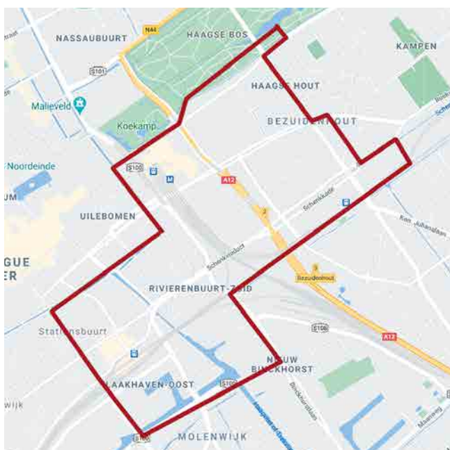
Overzicht van het CID-gebied (op basis van Google Maps)

Het CID bestaat op hoofdlijnen uit het gebied tussen de drie Haagse stations (CS, HS en Laan van NOI). De agenda voor het Central Innovation District heeft in de afgelopen jaren vele wijzigingen doorgemaakt. Waar het eerst nog een transformatiezone langs en op het spoor betrof, is het nu uitgegroeid tot een brede vlek op de kaart, waarbinnen de Binckhorst wordt verbonden met het Prins Bernhardviaduct. Daarmee wijzigt de opgave van de structuurvisie van een transformatie naar een ingrijpende sanering. Dat is een wezenlijk andere en veel omvattender opgave dan aanvankelijk werd beoogd.