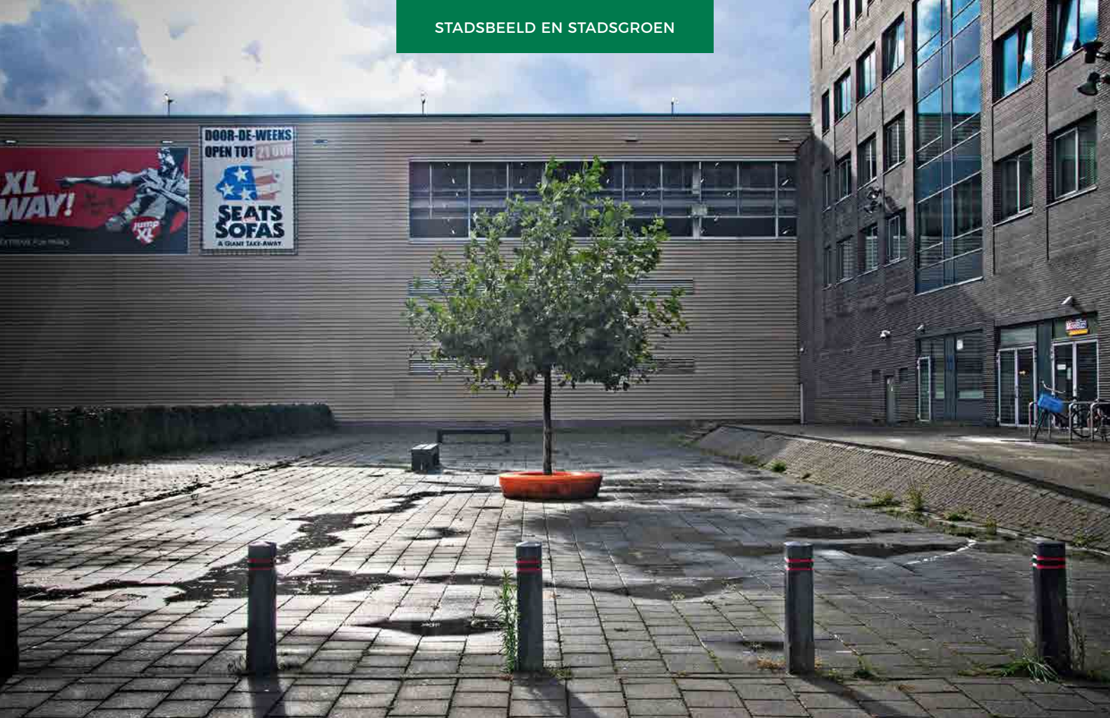
In de concept-structuurvisie voor het Central Innovation District (CID) belooft de gemeente Den Haag meer groen