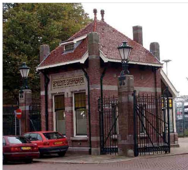
Industrieel erfgoed, zoals de Gemeentelijke Gasfabriek, verdient erkenning in een CID-erfgoedwandellint

De Vrienden van Den Haag juichen het toe dat voor de verdichting, die nodig is om aan de verwachte bevolkingsgroei te kunnen voldoen, naar dit gebied gekeken wordt. Zo wordt het risico verkleind dat nieuwe verdichtingsplannen afbreuk doen aan de typisch Haagse combinatie van natuurlijk groen en hoogwaardige klassieke architectuur in andere delen van de stad. Ook juichen de Vrienden het toe dat het stadsbestuur zich de huisvestingsvraag in de stad in brede zin aantrekt en daaraan wil voldoen met een stedelijke agenda van wonen en werken met alle daarbij behorende voorzieningen (scholen, zorginstellingen, winkels, vervoer, groengebieden en een integrale inpassing van sociale huurwoningen).