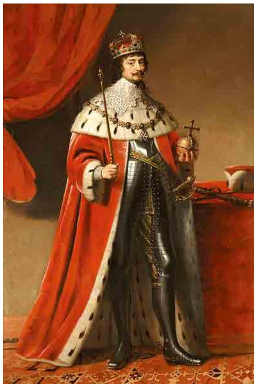
Frederik V van de Palts