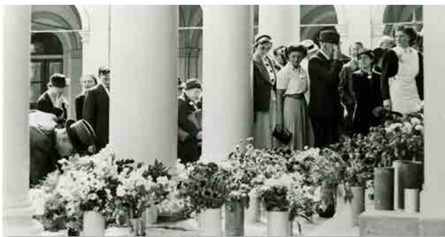
Anjerdag bij paleis Noordeinde op de verjaardag van prins Bernhard

9 Op 29 juni 1940 demonstreerde het Nederlandse volk zijn verbondenheid met het koningshuis en klonk met name in Den Haag en op kleinere schaal in andere steden protest tegen de bezetting. Op welke wijze gaf de Haagse bevolking bij paleis Noordeinde uiting aan haar protest?