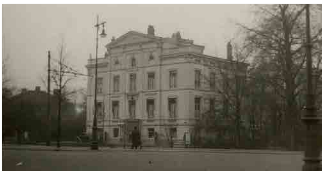
Scheveningseweg 17, Koninklijke Kunstzaal Kleykamp ca 1942