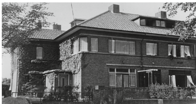
Nieuwe Parklaan 110, woning van koningin Wilhelmina, september 1945 - april 1946