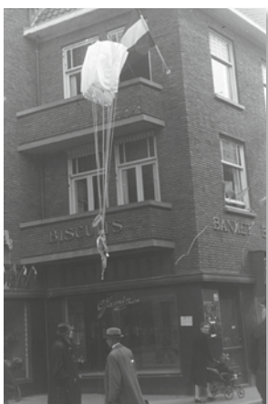
Vleerstraat, hoek Westeinde, aan het balkon boven een Jaminwinkel hangt een parachute van een dropping