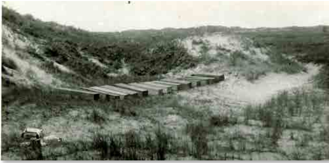
Kisten met stoffelijke resten die zijn opgegraven uit het massagraf op de Waalsdorpervlakte

7 Hoeveel gevangenen uit het 'Oranjehotel' zijn tijdens de bezetting door de Duitsers gefusilleerd op de Waalsdorpervlakte?