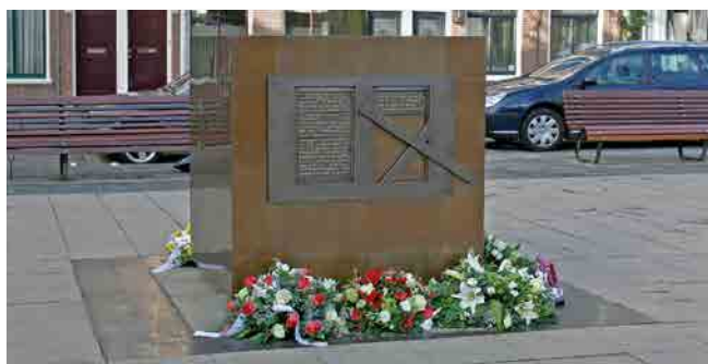
Monument ontworpen door Jan Verburg