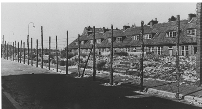
Interneringskamp Duinoord

George Maduro (naamgever van Madurodam, Nederlandse miniatuurstad in Den Haag op een schaal van 1 op 25, geopend op 2 juli 1952)