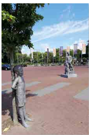
Beelden 'Kleine George' en 'Grote George' van Jikke van Loon op het voorplein van Madurodam