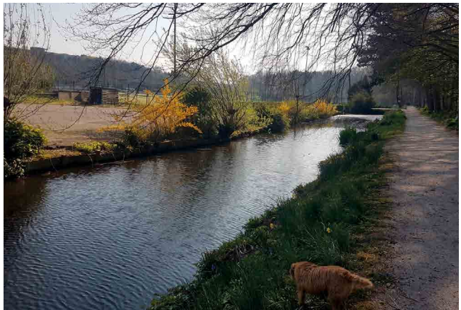
De zanderijvaart naar het kanaal in de vroege lente

De oorsprong van Klein Zwitserland voert ons dus terug naar de periode van de afgraving van het oorspronkelijke hoge duin, halverwege de 19 e eeuw. Met de afgraving werd geld verdiend, als funderingszand voor de toenmalige stadsuitbreidingen. Een afzanderijvaart werd aangelegd naar het