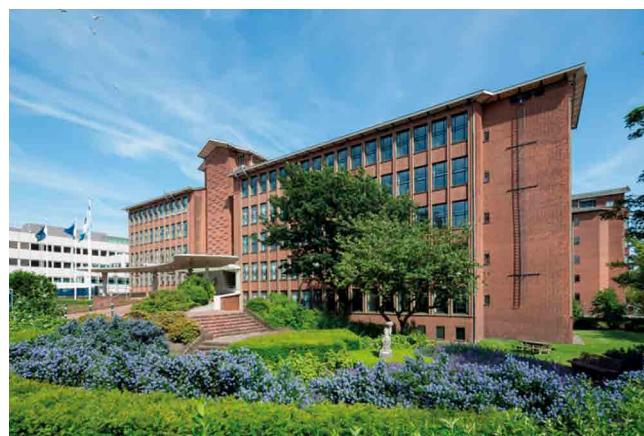
Voormalig Ministerie van Verkeer en Waterstaat en rijksmonument

Met de plannen voor het ministeriegebouw, nu samengevat onder de naam Plesmanduin, zal het gebruik van deze plek