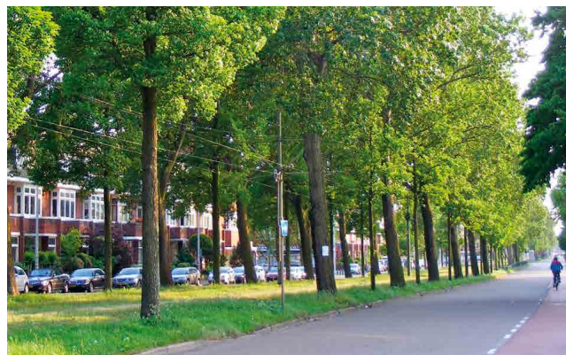
Laan van Meerdervoort, ter hoogte van de Vruchtenbuurt

van voornamelijk portiek-etagewoningen en een rijke samenhangende architectuur de 'ruimte Kunst' van de discipline zo in te zetten, dat je je op die lange Laan toch overal kunt oriënteren. Delen van het plan werden pas na de oorlog gerealiseerd, onder supervisie van Willem Dudok. Het Savornin Lohmanplein met zijn los in het groen geplaatste blokken, de Chinese Muur van architect Ottenhof en Meer en Bos rond de Ericalaan. Zowel in Wateringseveld als Ypenburg