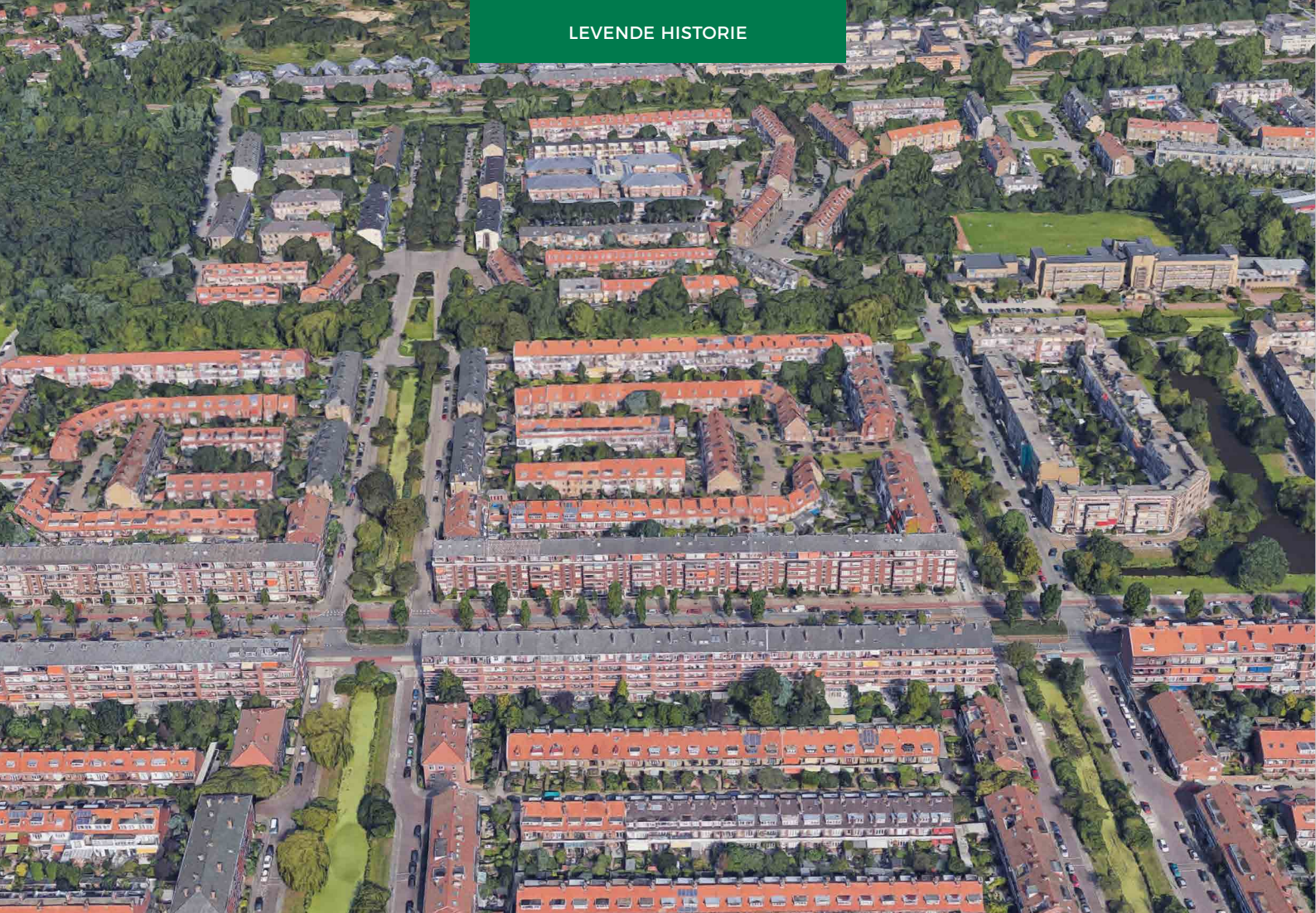
Dwarsverbanden op de Laan van Meerdervoort