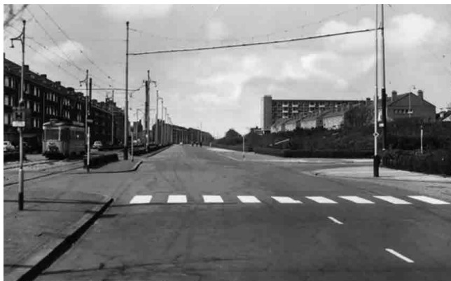
Ansichtkaart uit 1955. Laan van Meerdervoort, gezien vanaf de Pioenweg (rechts)

De vooroorlogse buurten krijgen doorgaans in hun hart een sportveld met een school, dat op een of andere manier een zichtlijn heeft naar de Laan van Meerdervoort. Een bijzondere uitwerking heeft ook het Pinksterbloemplein in Bohemen: