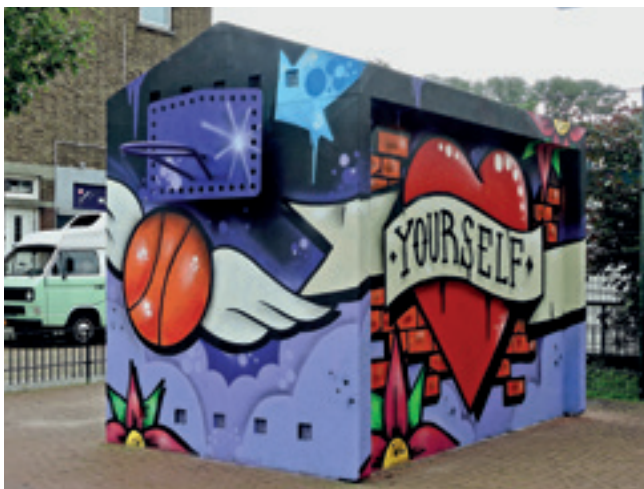
Davy de Ronde op elektriciteitshuisje Rustenburg Oostbroek.