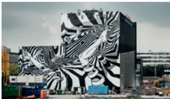
Bier en Brood op het Nederlands Danstheater.

Street Art betreft meer dan (illegale) graffiti. Het gaat om kunst in de openbare ruimte die voor iedereen kosteloos en te allen tijde te bezichtigen is. Een schone leefomgeving en kunst in de openbare ruimte leveren een belangrijke bijdrage aan een aangenaam leefklimaat. The Hague Street Art wil daaraan bijdragen door actief graffiti- en Street Art-projecten te organiseren.