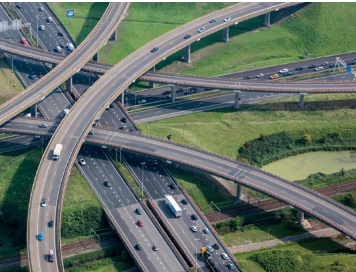
De schoonheid van grootschalige infrastructuur