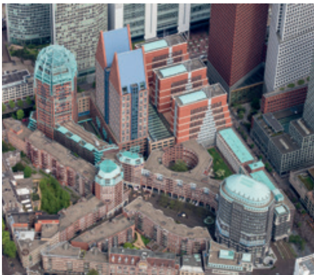
Verrassend perspectief op de Resident;