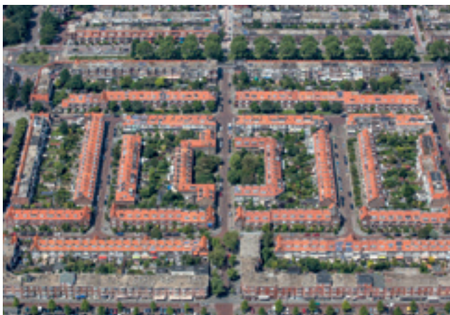
Het symmetrische stratenpatroon in de Vruchtenbuurt

Luchtfoto's bieden in ons platte land een mogelijkheid om over een groter gebied uit te kijken, en te zien wat op straat nauwelijks opvalt. Zo blijkt een gewone woonwijk een mooi ontworpen stratenpatroon te hebben. Zelfs grootschalige infrastructuur kan z'n eigen schoonheid bezitten. Soms gaat achter een rij individuele gevels een enorm gebouw schuil. En dan is er nog het 'dakenlandschap', waaraan we de totstandkoming van de panden en de buurt kunnen aflezen. Den Haag onbewolkt laat het allemaal zien. Wie niet als een planoloog de beelden wil analyseren, kan zich ook gewoon laten verrassen door een nieuwe kijk op vertrouwde stadsgezichten.