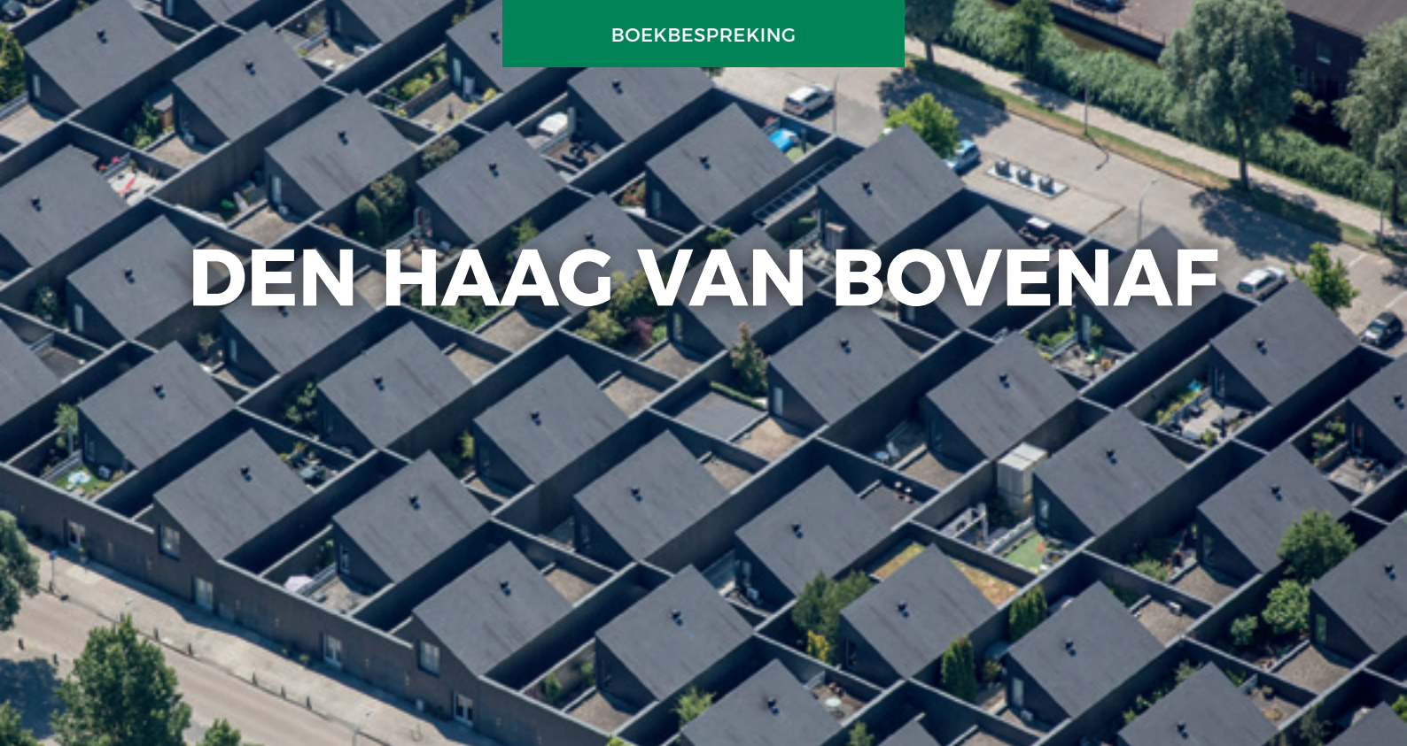
Het uniforme dakenlandschap van de patiowoningen in Waterwijk Ypenburg

Het stadsbeeld van Den Haag – een belangrijk onderwerp voor de Vrienden – is op luchtfoto's herkenbaar maar ook anders. Alsof je mooie nieuwe kanten van je geliefde ontdekt. Den Haag onbewolkt is aangenaam intrigerend.