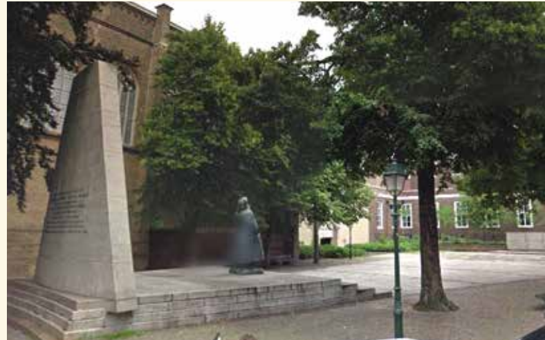
Het monument bekeken door de ogen van Google streetview

De vraag is of het weghalen van 'gedateerde elementen' legitiem zou zijn als er iets beters voor in de plaats kan komen, maar is de vernieuwing wel een verbetering? Het Wilhelminamonument benadrukt een episode, die bij het paleis hoort. Het vergroten van de koninklijke allure van het Paleisplein en het verhogen van het aantal bezoekers kan immers even