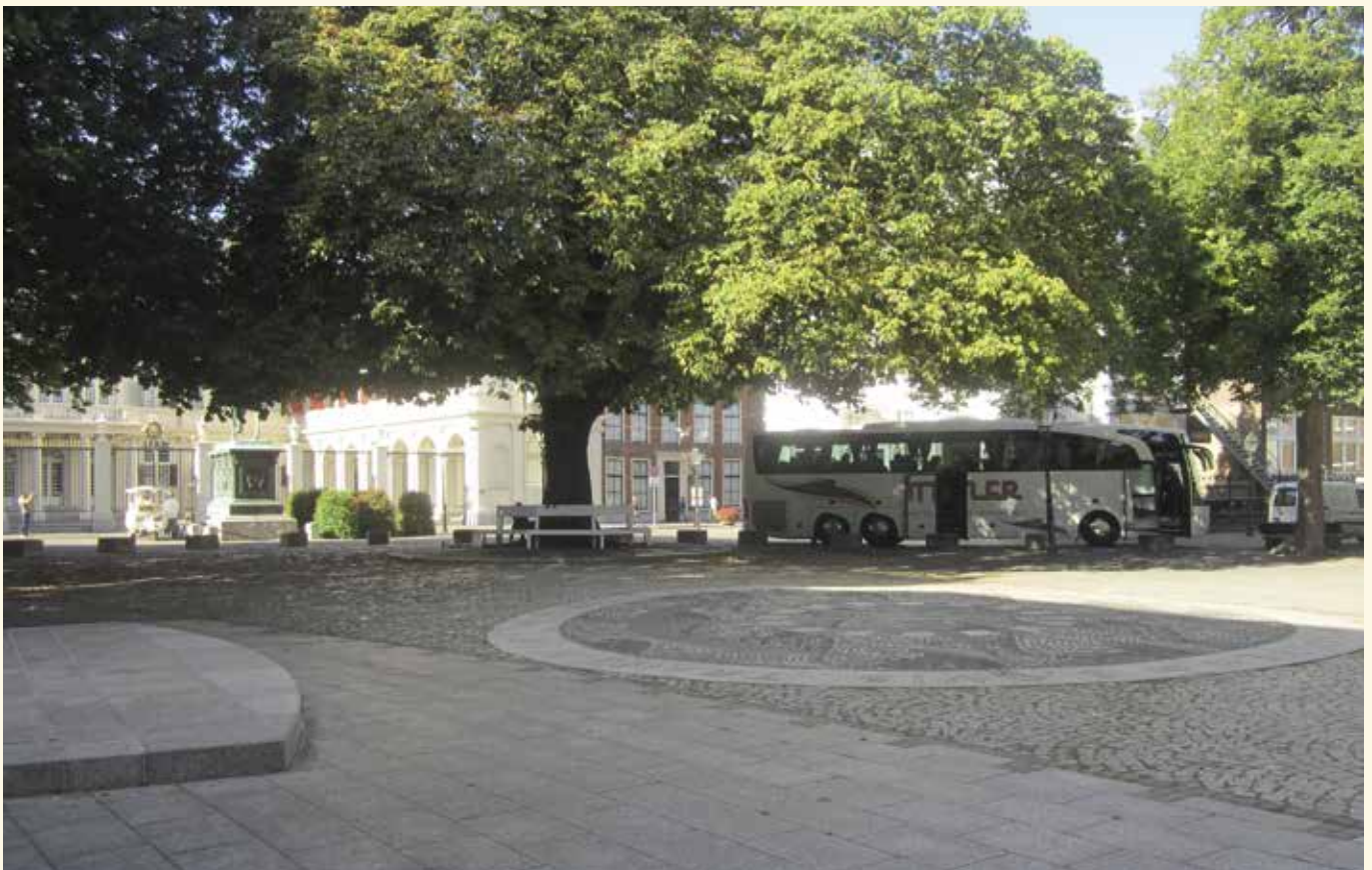
Situatie september 2016.

Als het Rijk, eigenaar van het monument, er iets aan wil veranderen, dan moeten daar wel zeer grondige redenen en draagvlak voor zijn. Bovendien zal er volgens de Auteurswet goedkeuring nodig zijn van de makers of hun rechtverkrijgenden.