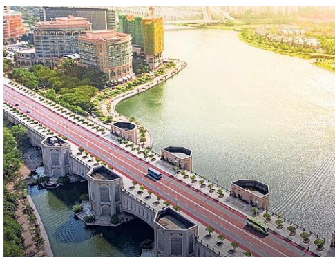
Ingenieursb- drijf Arcadis won 5,3% dankzij meevallende kwartaalcijfers. Degroof Petercam zag hierin aanleiding het advies op kopen te zetten.