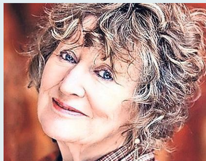
Oud-minister Hedy d'Ancona.