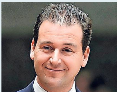
Lodewijk Asscher was tussen 2012 en 2015 minister in het iconische pand.