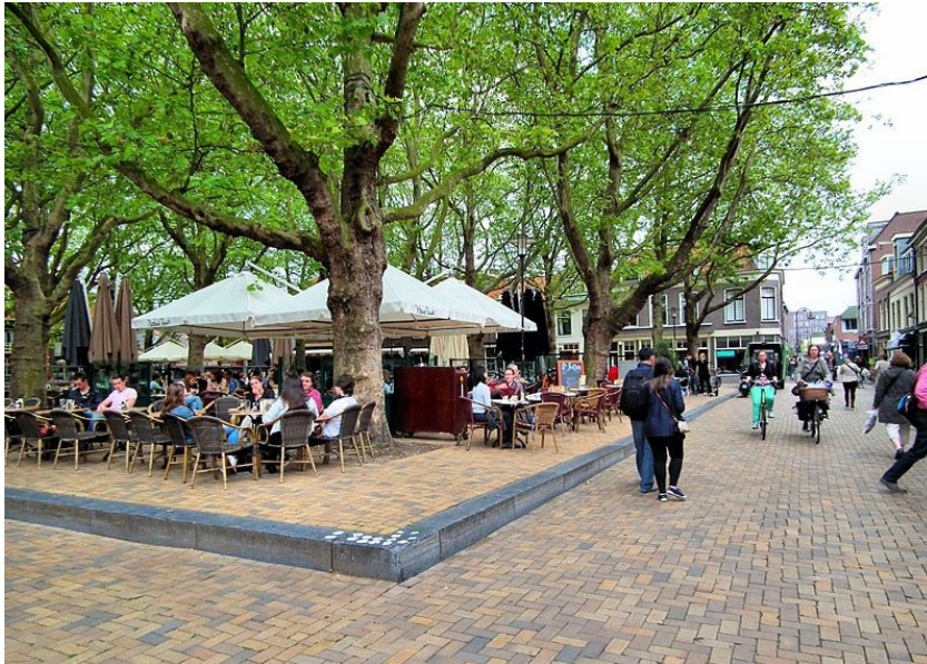
De Beestenmarkt in Delft

Voor de planontwikkeling is onderzoek nodig naar de belangrijkste basisvoorwaarden, naar de condities van de ondergrond, de te verzekeren toegankelijkheid voor bewoners en openbaar vervoer als wel voor de expeditie van de hier zittende bedrijven en winkels. Een meer verkeerskundige vraag is of de auto eruit kan en wat dat betekent voor de omliggende verkeerscirculatie. Ook het verkeer leent zich voor transformatie en dat vraagt om keuzes: Gaan de politiek voor de “early adapters” of niet? Met drie intercitystations in de nabijheid zou de bereikbaarheid van dit gebied opnieuw en modern ingevuld kunnen worden, met deelfietsen, naar het voorbeeld van de Beestenmarkt in Delft, met Platanen als een groen dak.