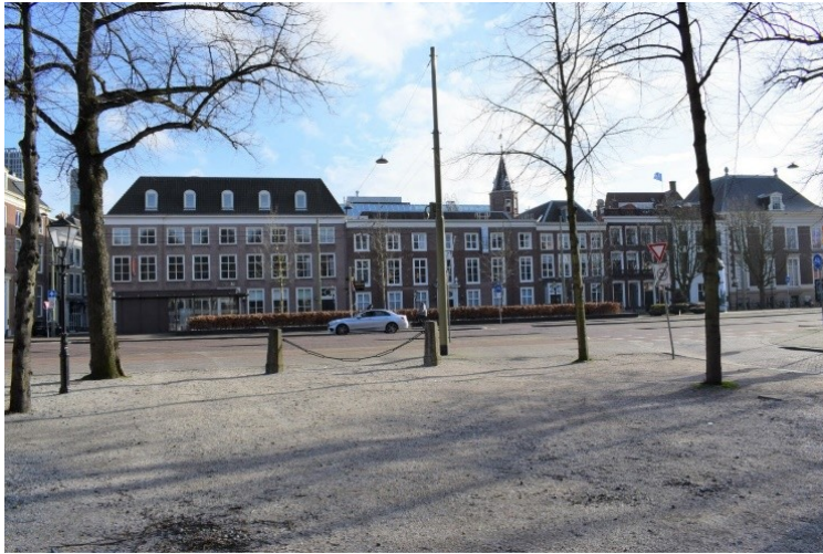
Tournooiveld Den Haag: Naast het torentje wordt nu een vierde bouwlaag toegestaan

In het binnenterrein treffen we een versteende en donkere wirwar van ontoegankelijke ruimten. Midden in de Lange Houtstraat verstoort een grijs-geel geruit modern gebouw, als een soort grafiekpapier de historische gevelrij.