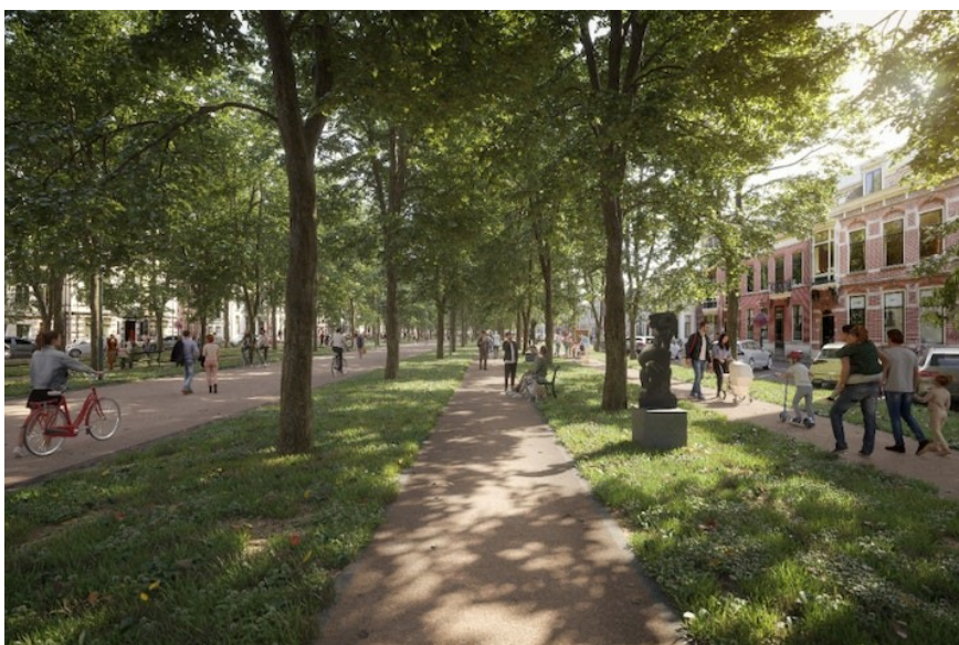
De nieuwe Maliebaan in Utrecht vanaf 2024,

De grote uitdaging is nu, in de dichte pakking van een stadscentrum en in onze haastige samenleving, dat de onderscheiden functies moeten mengen en elkaar verdragen. In de druk die dat met zich meebrengt is het zaak om met het groen een steevaste koers te blijven varen. Een voorbeeld van verdraagzame menging is wellicht de Maliebaan in Utrecht met Lindes, net zo uniek als het Voorhout. De herinrichting start eind 2024. Daarbij gaan twee autorijbanen in het midden plaatsmaken voor een fiets- en wandelpromenade, en kunnen automobilisten straks alleen nog over de twee ventwegen rijden. De Maliebaan wordt zo een plek om te 'verblijven en flaneren', wat dicht bij het idee van Haagse tuilerieën komt. Het initiatief daarvoor in Den Haag ligt er; nu doorpakken naar een daadwerkelijk reëel plan en een raadsbesluit.